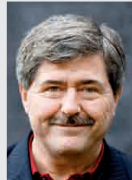
Af Søren Søndergaard, medlem af EU-Parlamentet, Folkebevægelsen mod EU