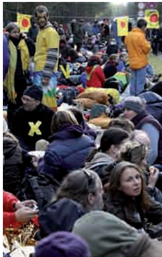
Tyske demonstranter i protest mod atomaffaldstransport i november i år.

Se artiklen "EU vil have planer for atomaffald" på Notat.dk