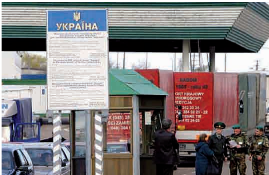
Flygtninge, som har søgt ind i EU fra Ukraine sendes rutinemæssigt tilbage.

Antallet af flygtninge, der forsøger at krydse grænsen mellem Ukraine og EU er faldet brat. Det skyldes dårlig behandling i Ukraine, mener menneskerettighedsorganisation.