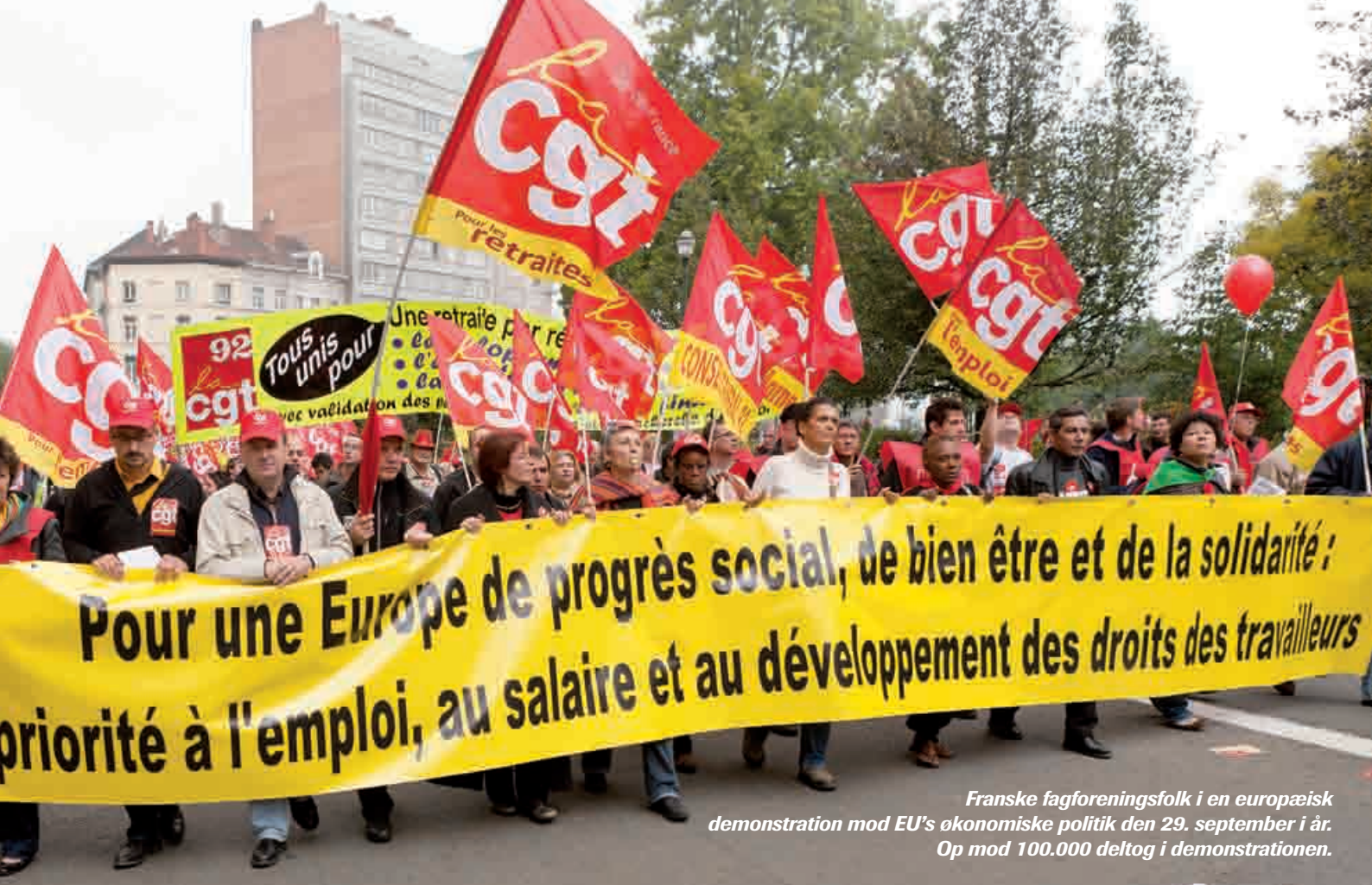
Franske fagforeningsfolk i en europæisk demonstration mod EU's økonomiske politik den 29. september i år. Op mod 100.000 deltog i demonstrationen.

og dermed med stor sikkerhed udløse en folkeafstemning i flere EU-lande, herunder Danmark.