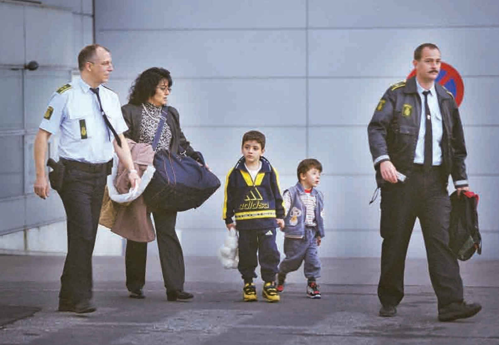
Politieskorte i Kastrup Lufthavn. Danmark er med i de vigtigste dele af samarbejdet om asylpolitik i EU. Det kan dog ændre sig i fremtiden.