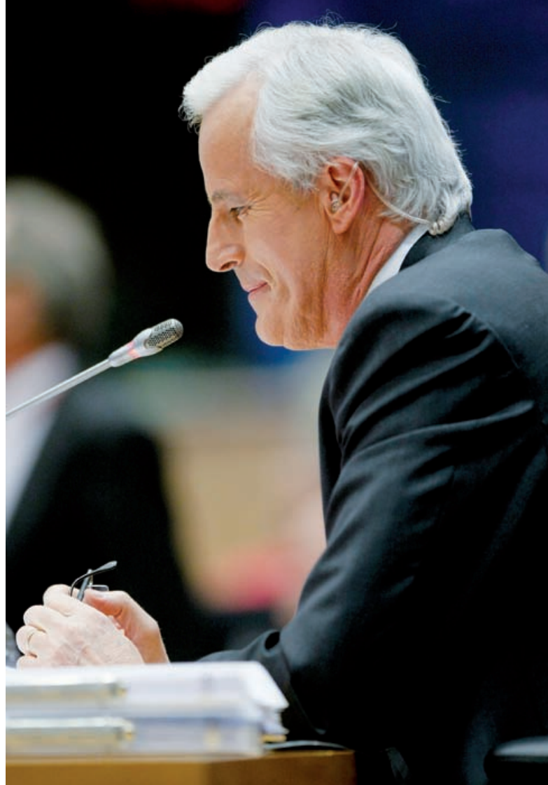
Kommissæren for det indre marked Michel Barnier blev udbedt et løfte om at ændre sammensætningen af hans rådgivende grupper allerede inden han formelt indtog sit embede. Hidtil er intet sket.

At Kommissionen hævder at holde interessekonflikter nede, modtages med et skuldertræk i ALTER-EU. Koalitionen ALTER-EU, der bl.a. rummer miljøorganisationer, fagforeninger og borgerrettighedsgrupper, er dannet for at skabe modvægt til erhvervslivets lobbyister. ALTER-EU har