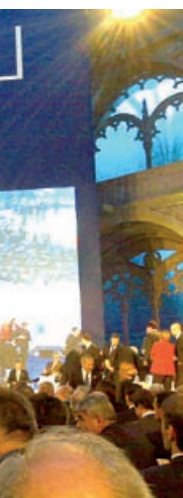
Fra ceremonien ved underskrivningen af Lissabon-traktaten i 2007.