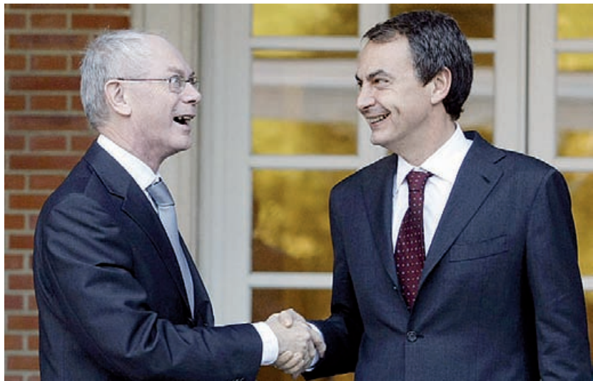
Formanden for EU-topmøderne Van Rompuy (tv.) og den spanske præsident Zapatero.

Efter Lissabon-traktaten trådte i kraft fik Det Europæiske Råd en fast formand,