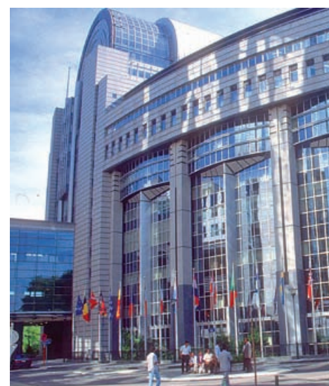
EU-Parlamentet i Bruxelles.

Man kan på en måde sammenligne Parlamentet med Folketinget i Danmark, idet vi selv vælger dets medlemmer, og kan genvælge dem, hvis vi er tilfredse med deres arbejde. En stor forskel er dog at Parlamentet ikke selv kan fremsætte forslag til lovgivning.