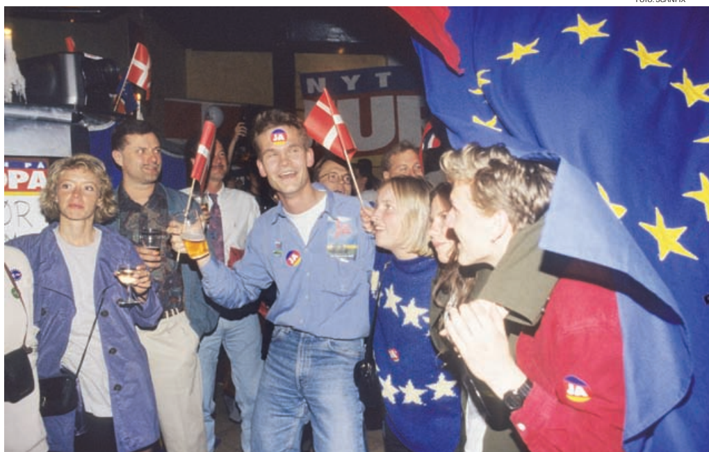
Glade ja-sigere efter et flertal i maj 1993 havde støttet Maastricht-traktaten med fire danske undtagelser ved en folkeafstemning.

Debatten har siden 1992 egentlig ikke ændret sig, og spørgsmålene er stadig: Skal vi have et fælles EU-forsvar, og skal Danmark være med i et sådant? Dog er der nu kommet fornyet fokus på emnet efter Lissabon-traktaten er trådt i kraft. Lissabon-traktaten strammer formuleringen til, at udviklingen med sikkerhed "vil føre til et fælles forsvar," og man indfører en slags fælles udenrigsminister og et fælles udenrigsministerium.