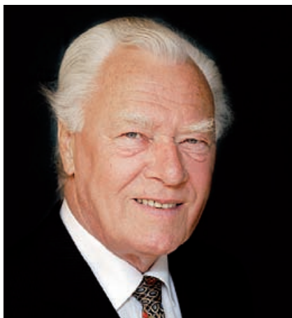
Statsminister Poul Schlüter kunne ikke få flertal i Folketinget for EF-pakken i 1986, men vandt en hastigt indkaldt folkeafstemning.

Det blev til Maastricht-traktaten , der i 1992 blev afvist af de danske vælgere ved en folkeafstemning. 50,7 procent stemte nej, og 49,3 procent stemte ja. Ved at ud-