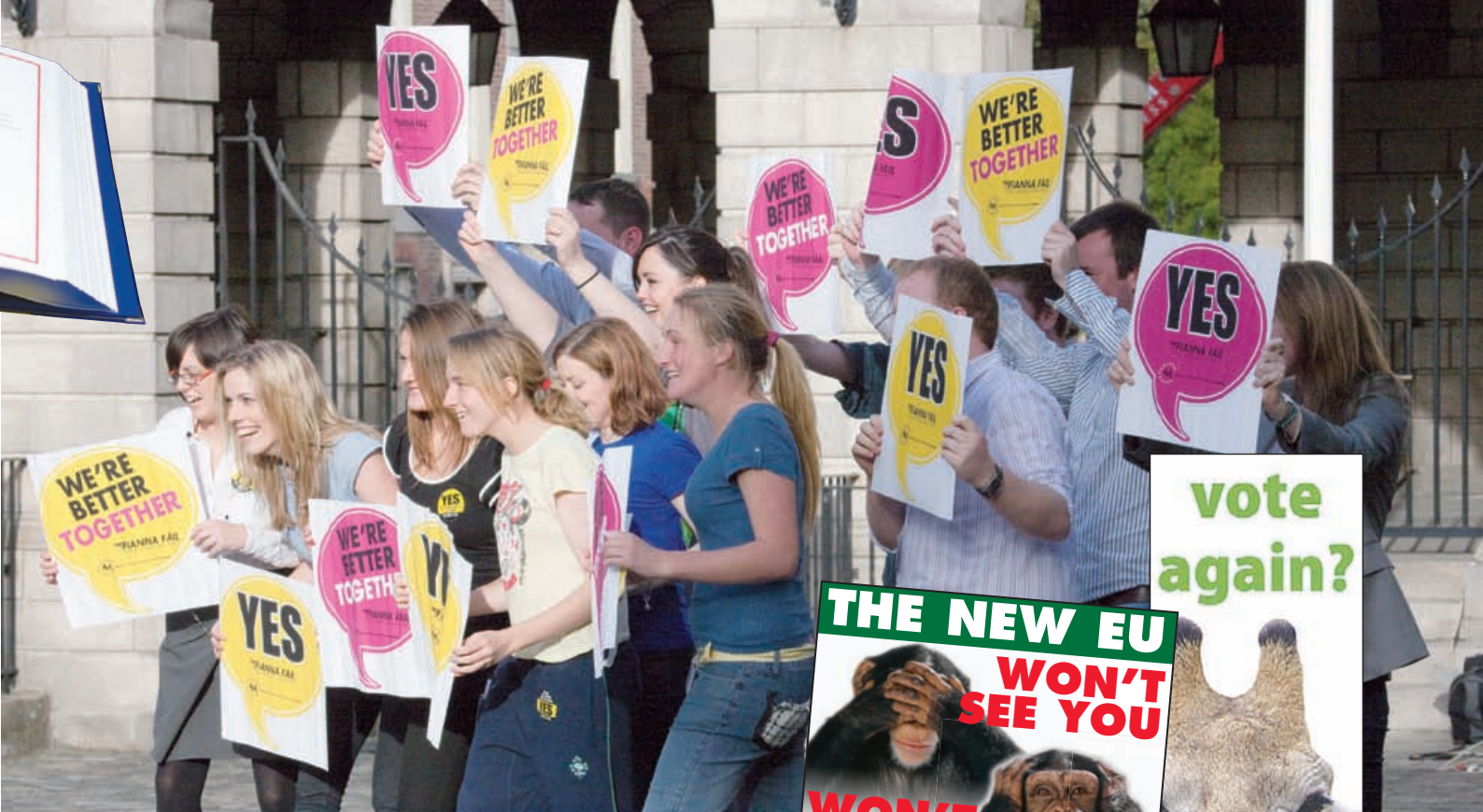
Plakater fra nej-siden og aktivister fra ja-siden fra debatten om Lissabon-traktaten. I 2005 havde to folkeafstemninger om traktaten. Første gang blev et nej, anden gang et ja."

Det er et andet aspekt af tab af indflydelse for nogle medlemslande.