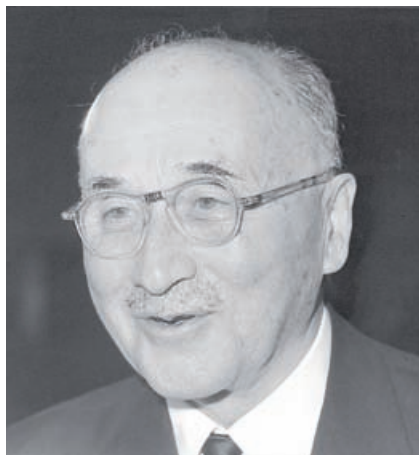
Jean Monnet, en fransk embedsmand, var initiativtager til dannelsen af Kul- og Stålnunionen, siden EF, som senere blev til EU.

Men i 1957 fik Monnet, med hjælp fra især den belgiske statsminister Paul-Henri Spaak, skabt en toldunion, Det Europæiske Økonomiske Fællesskab – i daglig tale kaldet "Fællesmarkedet", og fra 1967 kaldet Det Europæiske Fællesskab (EF) . De grundlæggende regler for Fællesmarkedet