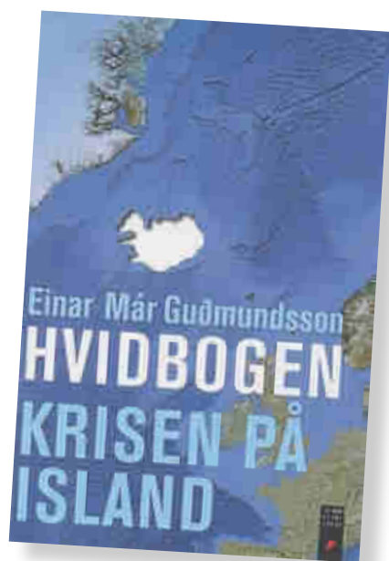
Einar Már Guðmundssons "Hvidbogen - Krisen på Island" er et anklageskrift mod finansyrster og neoliberale politikere i Island.

Et af socialdemokraternes vigtigste argumenter for at komme med i EU er at det