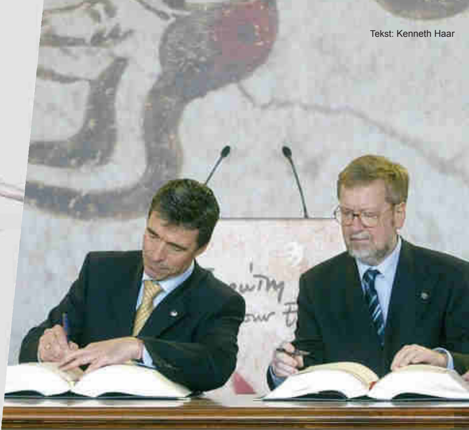
Daværende statsminister Fogh Rasmussen underskrev Lissabon-traktaten i 2007. Den trådte i kraft i december 2009.

Særlig opmærksomhed giver vi et område, som har været i hastig udvikling i kølvandet på indsatsen mod terrorisme; registrering og overvågning. I hele temaet spørger vi: Har borgerne de rettigheder, de har krav på?