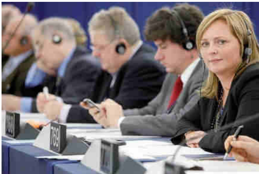
Det første EU-parlamentet gjorde med sine nye beføjelser var at stemme et forslag om overdragelse af borgernes bankoplysninger ned.

»I forhold til Stockholmsprogrammet (EU's 5-års-plan for retspolitisk samarbejde, red.) har Parlamentets reaktioner været, at man ikke har tænkt tilstrækkeligt