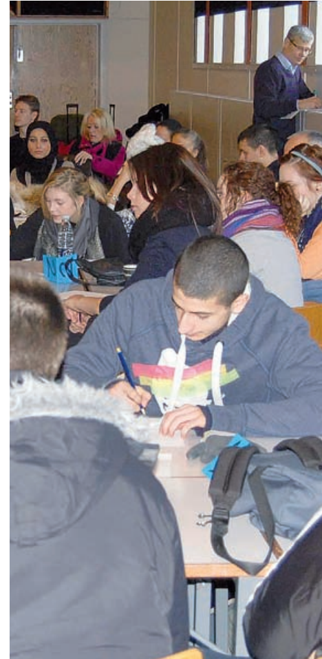
Elever fra to gymnasier gennemførte debatcafé om EU og klimaet, forestået af Oplysningsforbundet DEO.

Læs også mere om democraticaféer og om netværk for samfundsfaglærere.