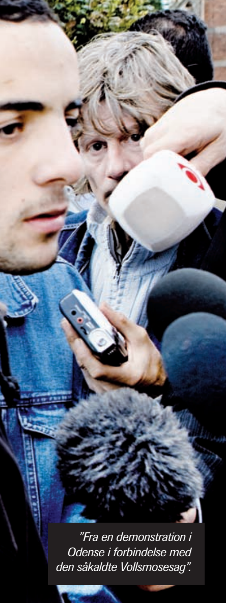
"Fra en demonstration i Odense i forbindelse med den såkaldte Vollsmosesag".