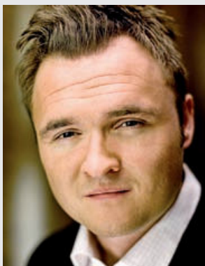
Dan Jørgensen, medlem af EU-Parlamentet, Socialdemokraterne