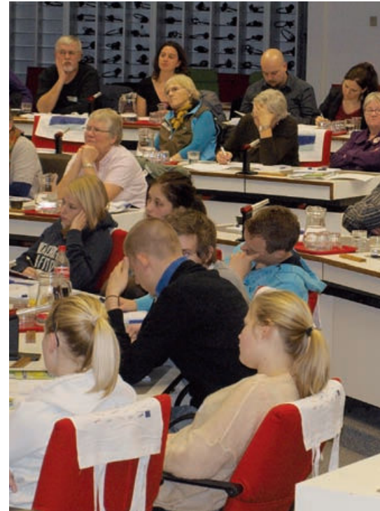
Gymnasieeleverne kappede de forreste pladser i EU-Kommissionens mødelokaler og sad klar med spidsede blyanter.

Fra den lille danske ambassade bevægede flokken sig over i et af Kommissionens mødelokaler. Her var gymnasieeleverne vågnet op. De kappede de forreste borde i det ovale mødelokale og sad klar med spidsede blyanter og hvide blokke klar til at notere eventuelle guld-korn eller mulige fortalelser.