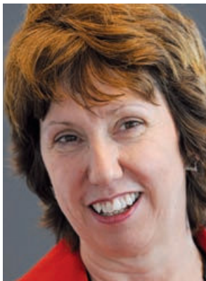
Den britiske baronesse Catherine Ashton blev overraskende EU's ny 'udenrigsminister'. Hun er medlem af Labourpartiet og har siden oktober 2008 været EU-handelskommissær.

Derfor bliver Catherine Ashton kaldt for den højststående repræsentant og ikke minister, og hendes forvaltning bliver kaldt Tjenesten for EU's Optræden Udadtil, eller lidt kortere Udenrigstjenesten.