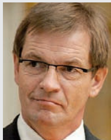
Bendt Bendtsen, medlem af EU-Parlamentet, Konservative

Det er her i november 20 år siden, at Berlinmuren faldt. Dermed blev Øst- og Vesteuropa forenet, og der blev dannet grundlag for det udvidede EU med de 27 medlemmer, vi kender i dag. Og når nu Lissabontraktaten træder i kraft, er der mulighed for at skrive endnu et kapitel i EU's historie og forstærke samarbejdet.