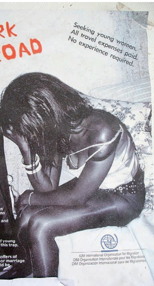
En plakat fra den Internationale Organisation for Migration (IOM) advarer unge piger mod tilbud om lukrative jobs i udlandet.