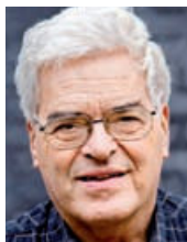
Kommentar af Sven Skovmand

20. oktober 2009 gav den danske regering det russiske selskab Gazprom lov til at føre en gasledning syd for Bornholm. Sverige og Finland har også sagt ja.