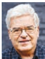
Af Sven Skovmand