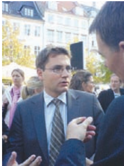
Justitsminister Brian Mikkelsen har opbakning til en aftale som kan overføre følsomme personoplysninger til Israel.

Følsomme oplysninger defineres som oplysninger om personers race, politiske holdninger, religiøse tro, sundhedstilstand og seksuelle adfærd (»sexual life«).