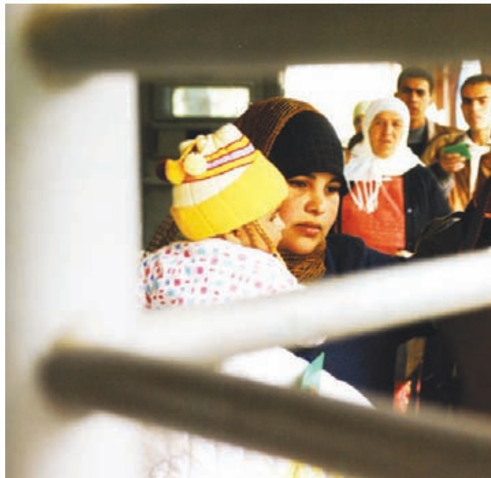
Mens fredsforhandlingerne står i stampe, har skiftende israelske regeringer forstærket adskillelsen mellem israelere og palæstinensere. På billedet den nye checkpoint-terminal i Kalandia fra 2005 som tusinder af palæstinensere dagligt passerer.

Som en udløber af fredsforhandlinger i de såkaldte Oslo-aftaler blev der i 1994 skabt et Palæstinensisk Selvstyre på dele af