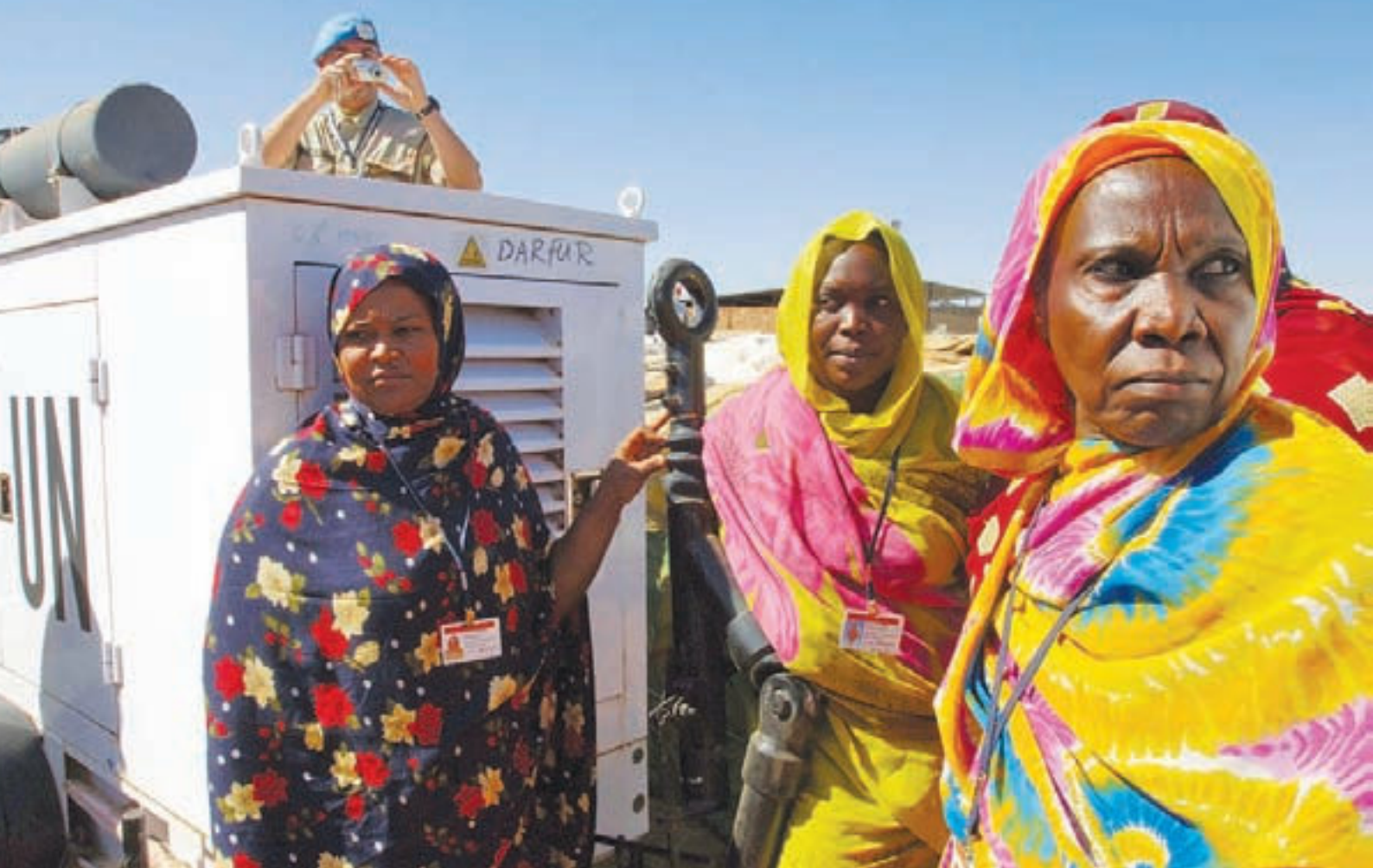
Fra FN-missionen UNMIS i Sudan hvor SHIRBRIG i 2005 stillede med et hovedkvarter og andre faciliteter.