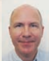
Erling Böttcher redaktør

Det er og bliver en indviklet sag at tage stilling til EU's forsvarspolitik, og hvorvidt Danmark skal være med eller ej. Det viser blandt andet vanskelighederne i Afrika (side 14 og 16). Vi håber med denne udgave af NOTAT at give stof til debatten om den forsvarspolitiske udvikling i Europa. God læselyst.