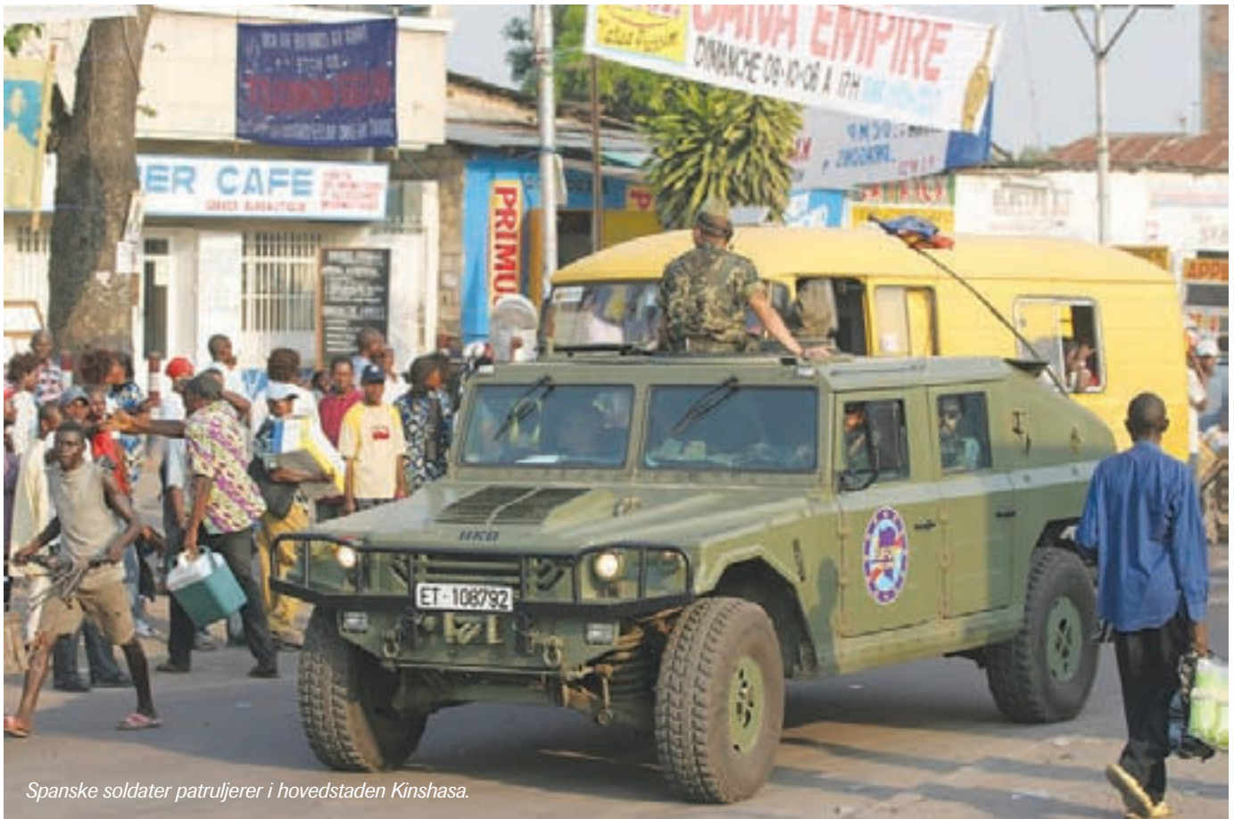
Spanske soldater patruljerer i hovedstaden Kinshasa.

Trods ufattelige lidelser for befolkningen i Den Demokratiske Republik Congo er EU stort set ude af stand til at handle. Uanset hvad EU gør, bliver det af nogle anset for en part i konflikten på grund af Belgien og Frankrigs tidligere handlinger i landet.