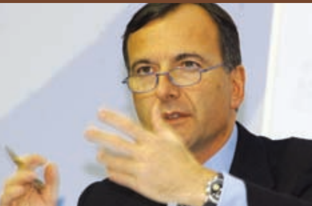
Under den nuværende retskommissær Franco Frattini er antallet af initiativer på retsområdet steget.

Schengen-samarbejdet startede i 1985 som et samarbejde mellem Tyskland, Frankrig, Belgien, Holland og Luxemburg, med det formål at skabe et fælles område uden indre grænser. Samarbejdet omfatter nu 13 EU-lande samt Island og Norge. Fra 2008 vil