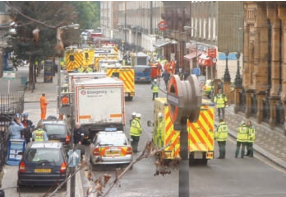
Finansiering af terror behøver ikke koste en formue. Ingredienserne til terrorbomberne i London, juli 2005, kunne betales blot ved at spare på sine lomme penge.

har medført ikke alene irriterende, men også for mange ydmygende fremvisninger af nødvendig medicin og drikkevarer og medført at lufthavnene bugner med konfiskerede vandflasker og parfumer. Men det har ikke forhindret at det er muligt at lave en bombe også med mindre end 100 milliliter.