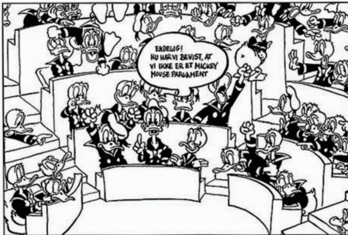
Tegneren Roald Als havde denne kommentar da Europa-parlamentet i 1999 truede med at afsætte Kommissionen på grund af korruption og svindele med EU-midler. Kommissionen valgte derefter selv at gå af. Bragt i Politiken, 23. marts 1999.

stemmeurnerne i 2004. En af årsagerne til den manglende interesse fra vælgernes side er, at hovedparten af de 785 er ukendte i deres egne lande.