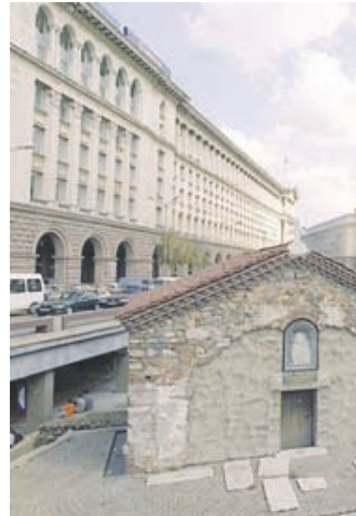
A general view of downtown Sofia.