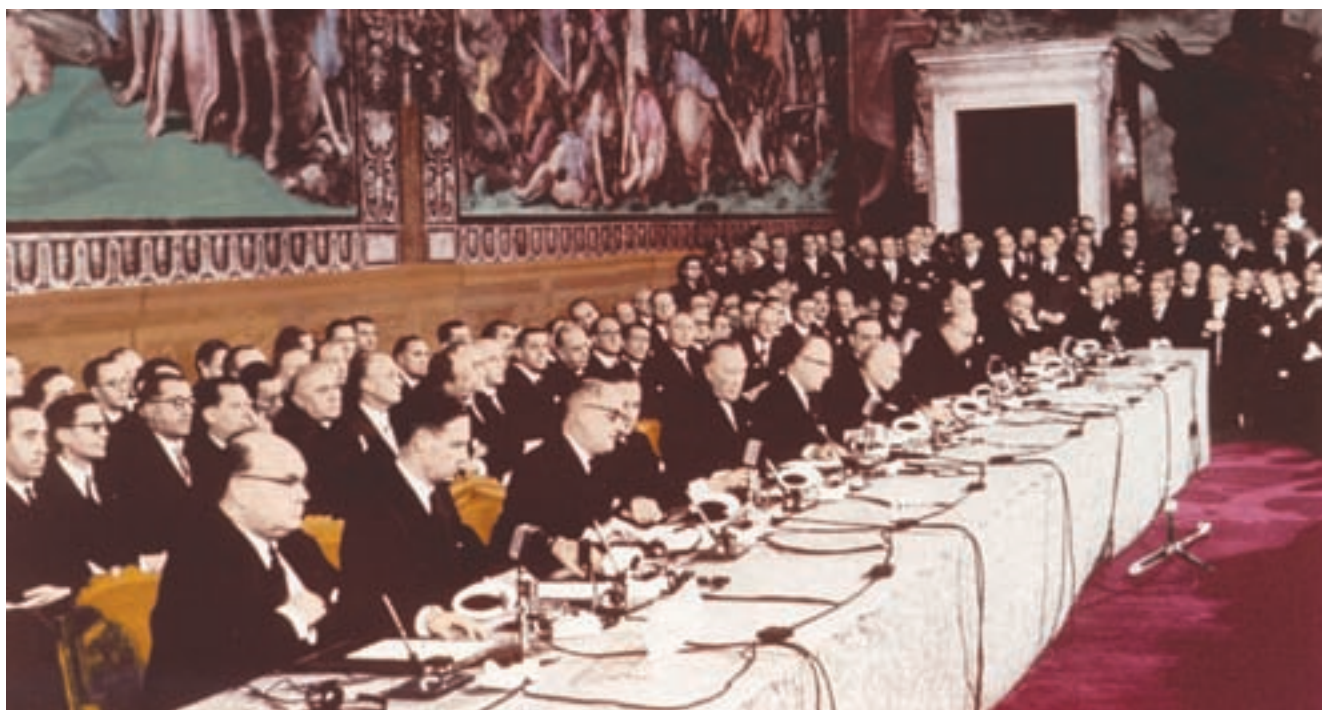
Rom-traktaten underskrives 25. marts 1957.

Efter krigen var Schuman deputeret frem til 1962. Han var finansminister under Bidault i 1946 og regeringsleder 1947-48. I denne periode stod han for en inflationsdæmpende politik og en hård kurs over for de store strejker, som blev ledet af den stærke kommunistiske del af fagbevægelsen. Som udenrigsminister i 1948-53 arbejdede Schuman ihærdigt for fransk-tysk forsoning og europæisk integration. ♦