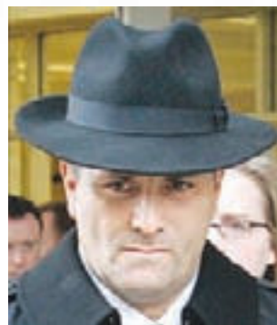
Jack Abramoff, slap med en fængselsdom på fem år og ti måneder til gengæld for samarbejde med politiet.

Blandt klienterne var indianerstammer som kæmpede for deres rettigheder til at drive kasino. Over tre år betalte de ham 80 mio. dollar. Abramoff dirigerede bidragene til et public relations firma som i hemmelighed ekspederede omkring halvdelen af pengene tilbage til Abramoff. ♦