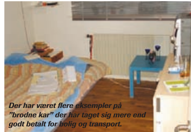
Der har været flere eksempler på "brodne kar" der har taget sig mere end godt betalt for bolig og transport.