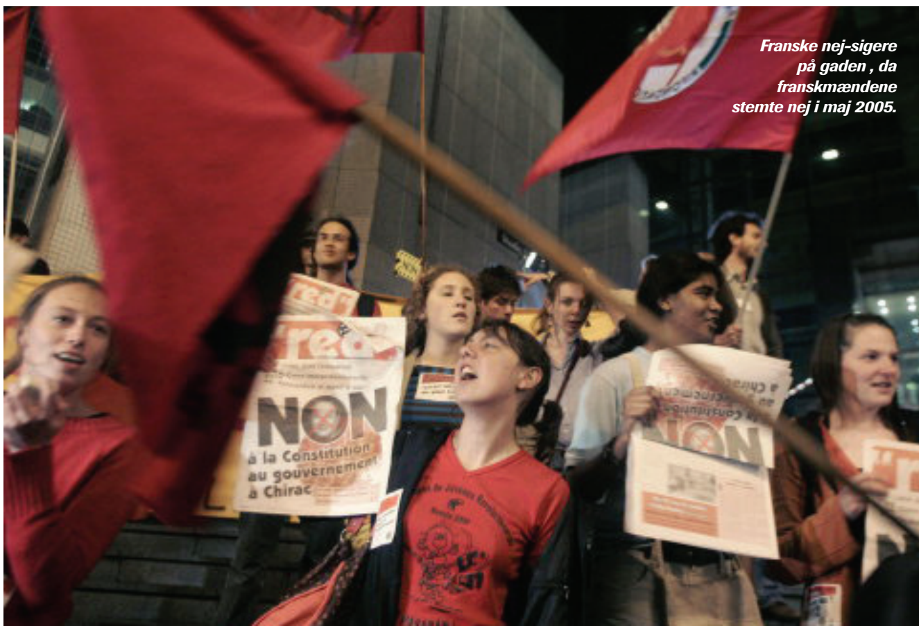
Franske nej-sigere på gaden, da franskmændene stemte nej i maj 2005.