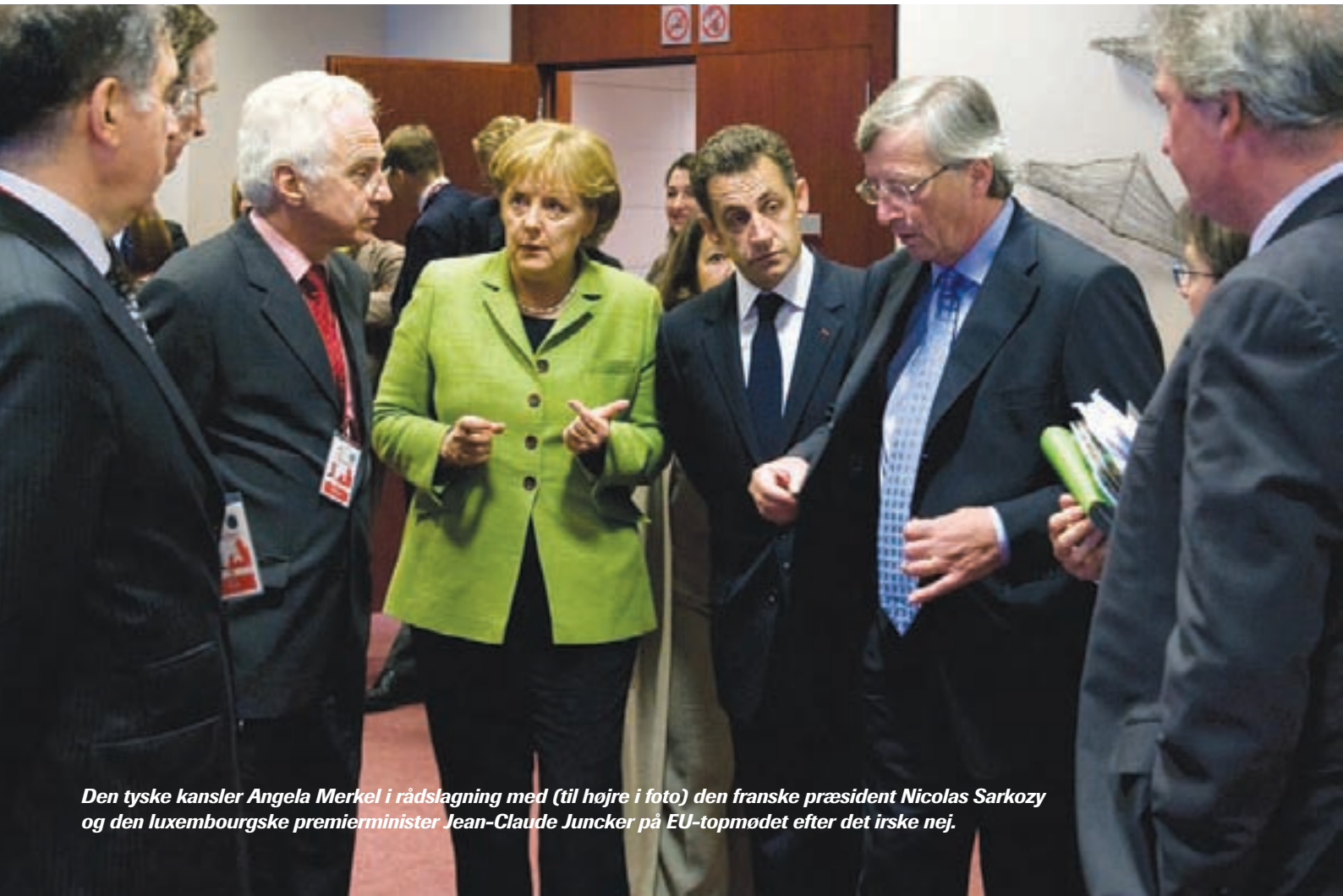
Den tyske kansler Angela Merkel i rådslagning med (til højre i foto) den franske præsident Nicolas Sarkozy og den luxembourgske premierminister Jean-Claude Juncker på EU-topmødet efter det irske nej.