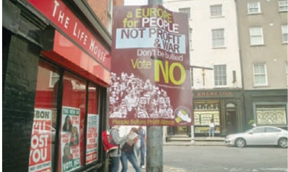
Plakat fra venstrefløj: "Et Europa for mennesker, ikke for profit og krig. Lad dig ikke skræmme. Stem nej!"

Der næst kom en række andre grunde: generel mistillid til politikerne, et ønske om at bevare irsk neutralitet i forsvars- og sikkerhedspolitikken, ønsket om at bevare en fast irsk kommissær, og beskyttelse af det irske skattesystem blev alle angivet af 6 procent af de adspurgte.