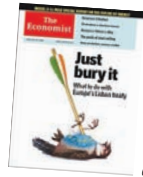
Forsiden af tidsskriftet The Economist : "Begrav den blot" (Lissabon-traktaten)

Hverken at finde den formel som kan flytte tilstrækkeligt mange nej-stemmer over på ja-siden. Eller at parkere det irske nej som et "irsk problem". ♦