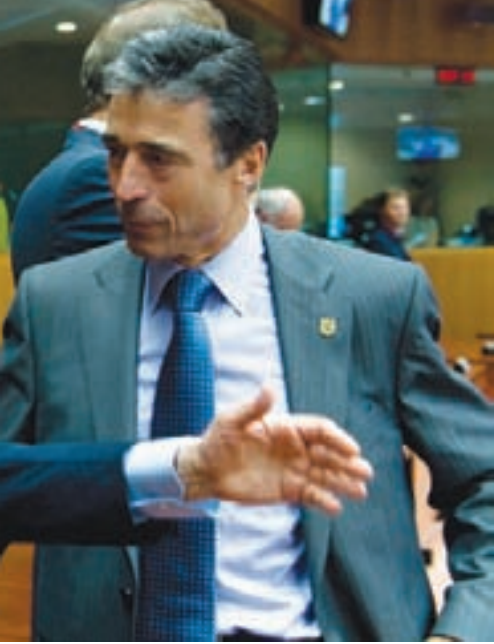
Anders Fogh Rasmussen snakker med Italiens premierminister Silvio Berlusconi.

gene også i andre lande, mest højlydt i Tjekkiet.