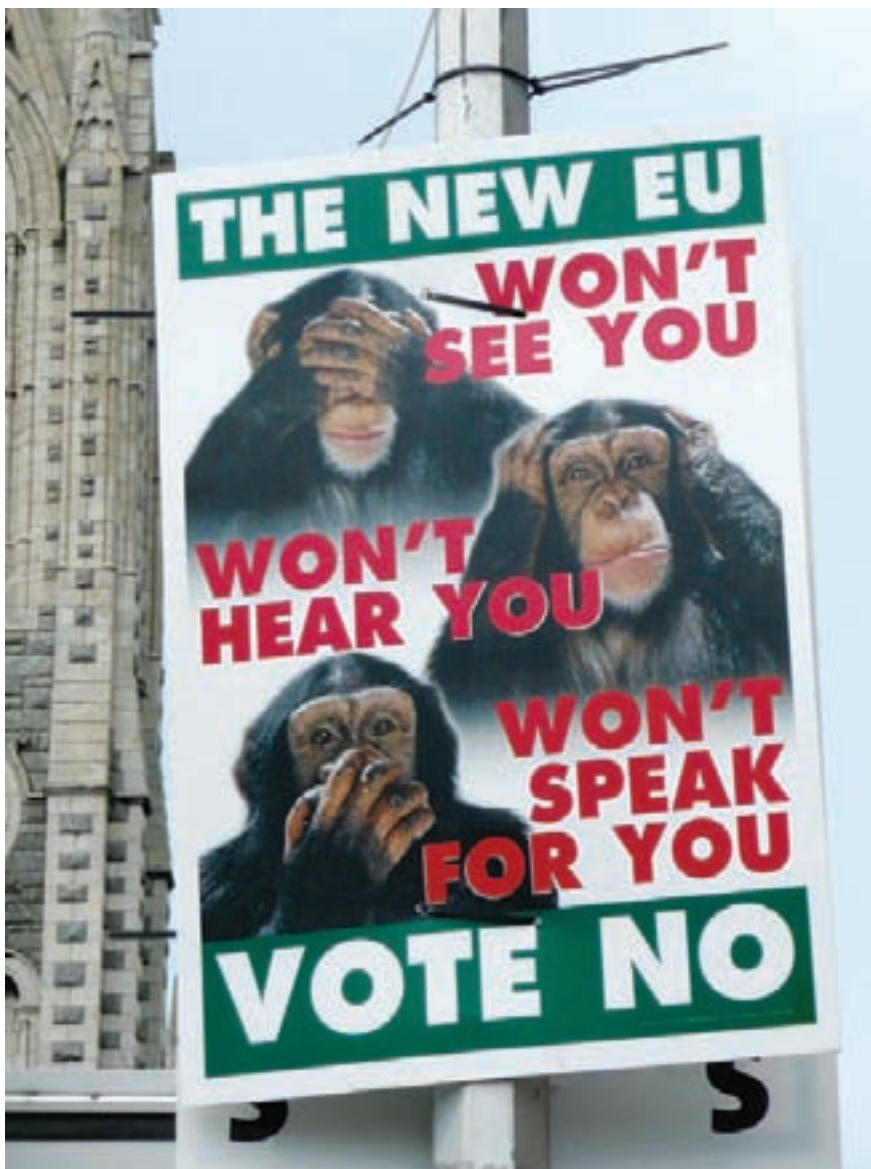
Nej-plakat fra den katolske organisation Cóir: "Det nye EU: Vil ikke se dig. Vil ikke høre dig. Vil ikke tale for dig. Stem nej!"