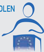
Af Morten Messerschmidt, MEP for Dansk Folkeparti