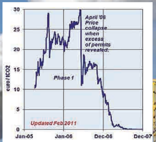
Prisudviklingen på forureningstilladelser 2005-07

NOTAT er idag en del af Oplysningsforbundet DEO, så du får også invitation til levende debatarrangementer under sloganet "EU-debat, mere spændende og mindre fastlåst"