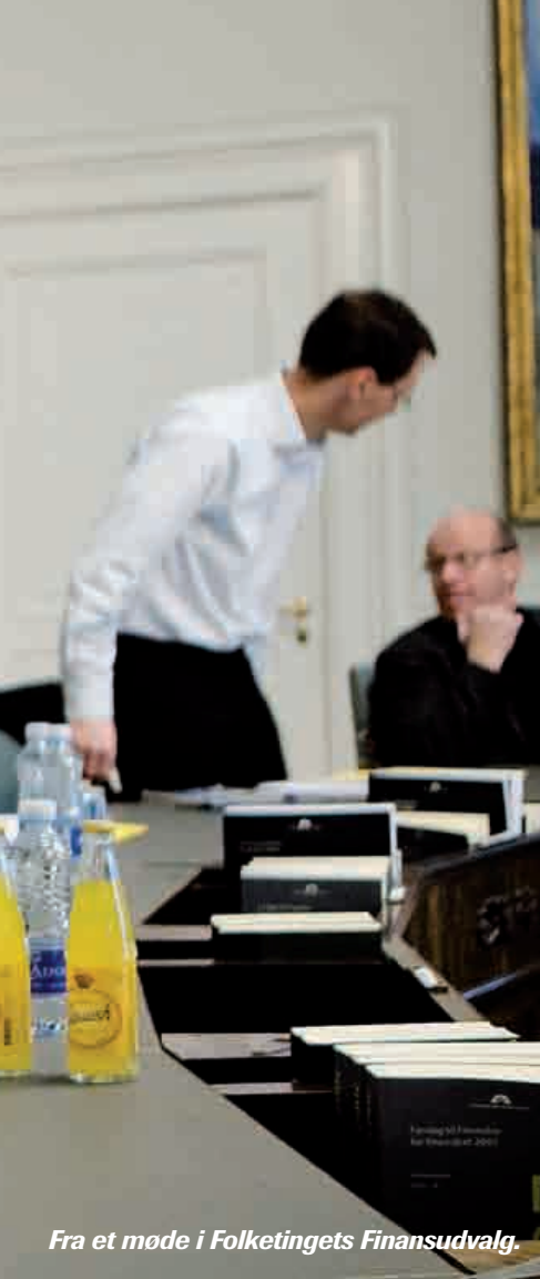
Fra et møde i Folketingets Finansudvalg.

»Den påstand er jeg fuldstændig enig i, men jeg har aldrig mødt et medlem af Folketinget, som er blevet valgt på sine EU-holdninger,« siger hun.