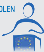
Morten Messerschmidt, medlem af EU-Parlamentet, Dansk Folkeparti