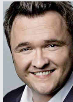
Af Dan Jørgensen , medlem af EU-Parlamentet for Socialdemokraterne