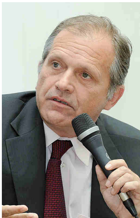
Østrigske Ernst Strasser (MEP) er færdig i politik efter en bestikkelsesskandale.

Tilsyneladende kan den slags gi' rigtig godt. Den ene politiker - østrigeren Ernst Strasser - påstod under en samtale med de forklædte journalister, at han har kunnet tjene hele 4 millioner kroner om året på håndsrækninger til private købere af indflydelse.