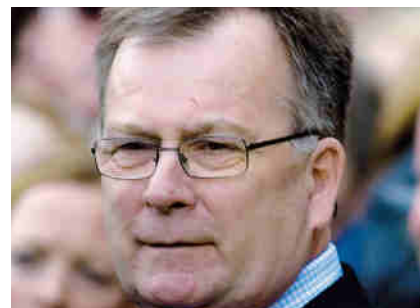
Finansminister Claus Hjort Frederiksen har længe talt for behovet for at afskaffe efterlønnen. Men han kan ikke hente støtte i EU's statistik.

Danmark havde i 2009 ikke et egentligt problem, mente EU-økonomerne, og