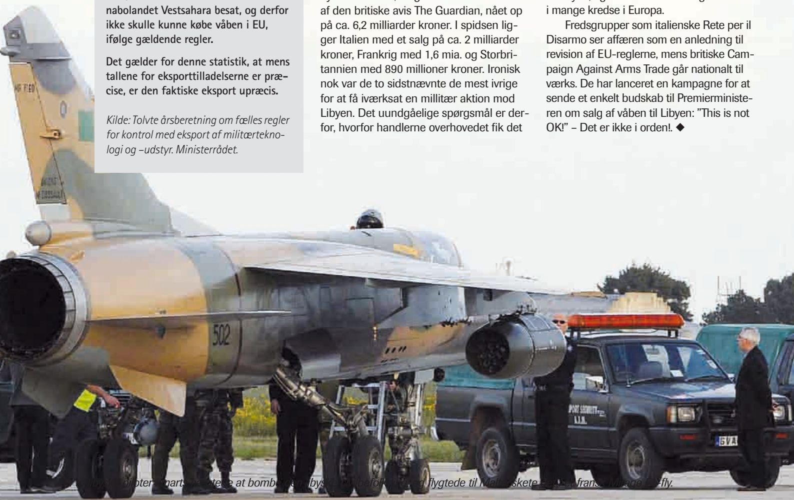
Helikopter, marts 2011. Bente at bombe i Libyen. En helikopter blev flygtede til Malta skete på en fransk ubådede fly.

Fredsgrupper som italienske Rete per il Disarmo ser affæren som en anledning til revision af EU-reglerne, mens britiske Campaign Against Arms Trade går nationalt til værks. De har lanceret en kampagne for at sende et enkelt budskab til Premierministeren om salg af våben til Libyen: ”This is not OK!” – Det er ikke i orden! ♦