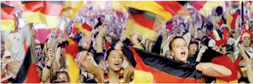
VM i Tyskland 2006. Værtslandet endte som nr. 3.