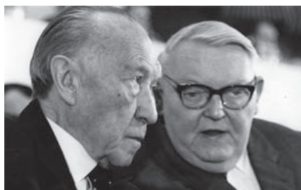
Konrad Adenauer (tv) og Ludwig Erhard.