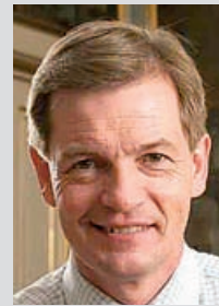
Af Bendt Bendtsen, MEP (K)