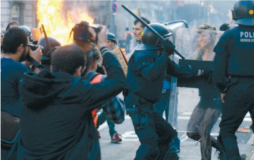
Demonstrationer endte i vold i Barcelona 29. marts.