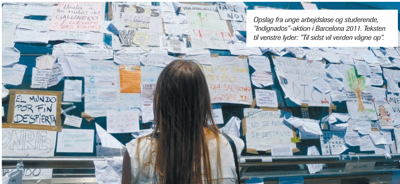
Opslag fra unge arbejdsløse og studerende, "Indignados"-aktion i Barcelona 2011. Teksten til venstre lyder: "Til sidst vil verden vågne op".