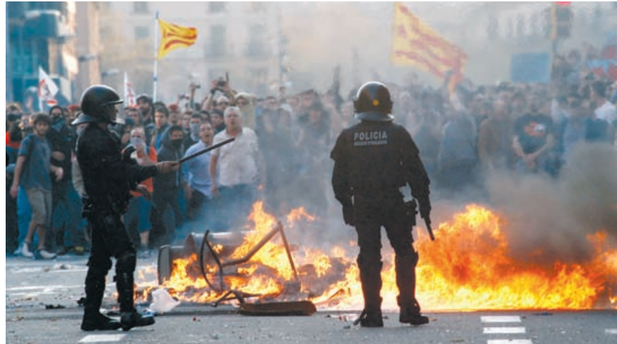
Gadekampe i Barcelona, 29. marts 2012.