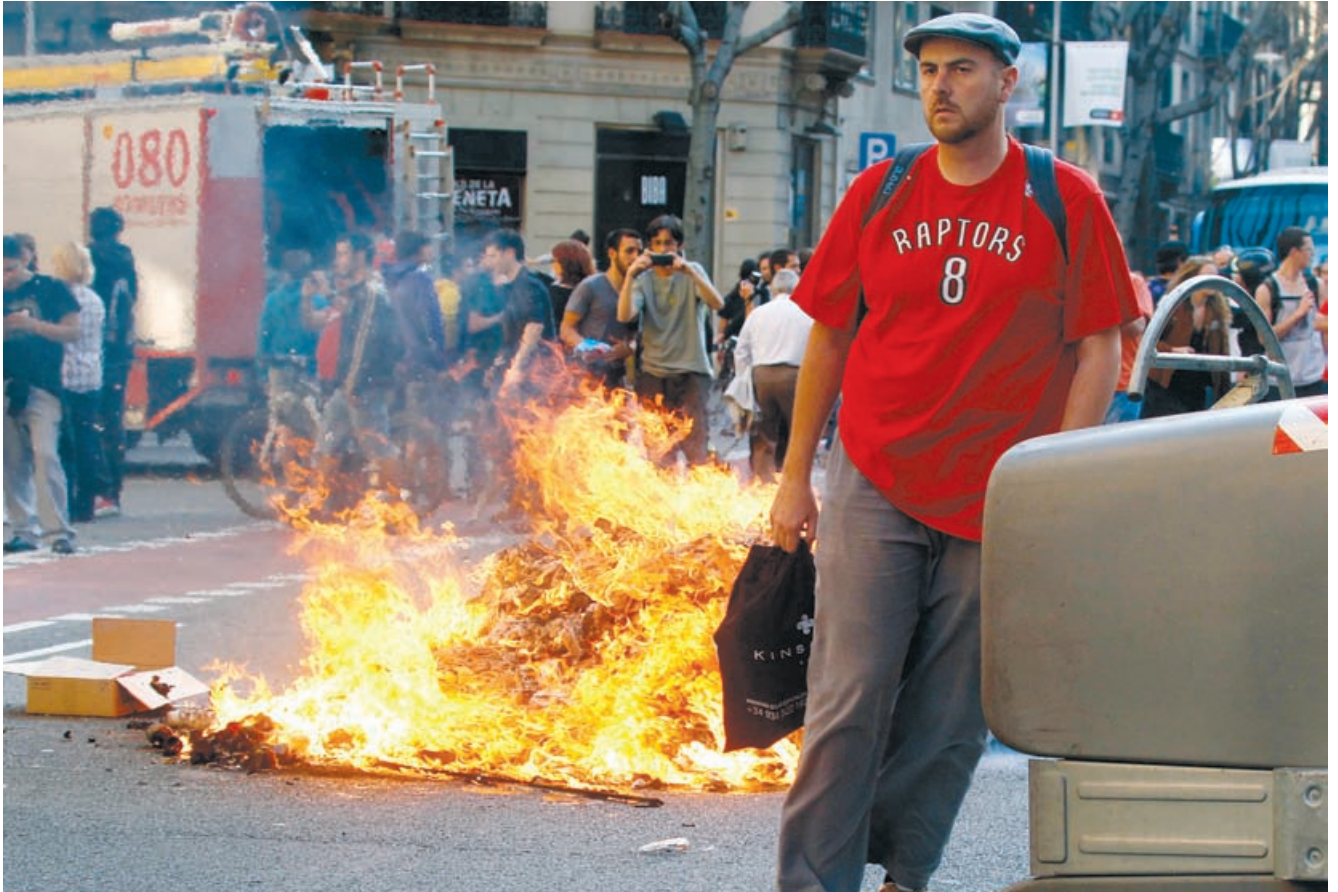
Fra demonstrationerne i forbindelse med generalstrejken, Barcelona, 29. marts.