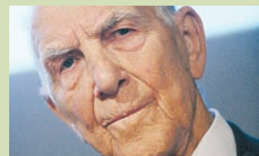
Den franske diplomat Stéphane Hessel er én af forfatterne til FN's Verdenserklæring om Menneskerettighederne fra 1948.

Mange unge frygter en politisering af 15M efter regeringsskiftet den 20. november 2011 til det centrum-højredrejede Partido Popular (Folke-partiet).