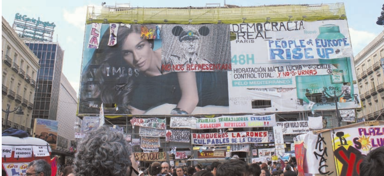
Indignados, Barcelona, 2011. "Bankfolkene er skyld i krisen" og "Vi lader os ikke repræsentere" står der bl.a.