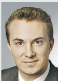
Af Morten Messerschmidt, MEP (O)