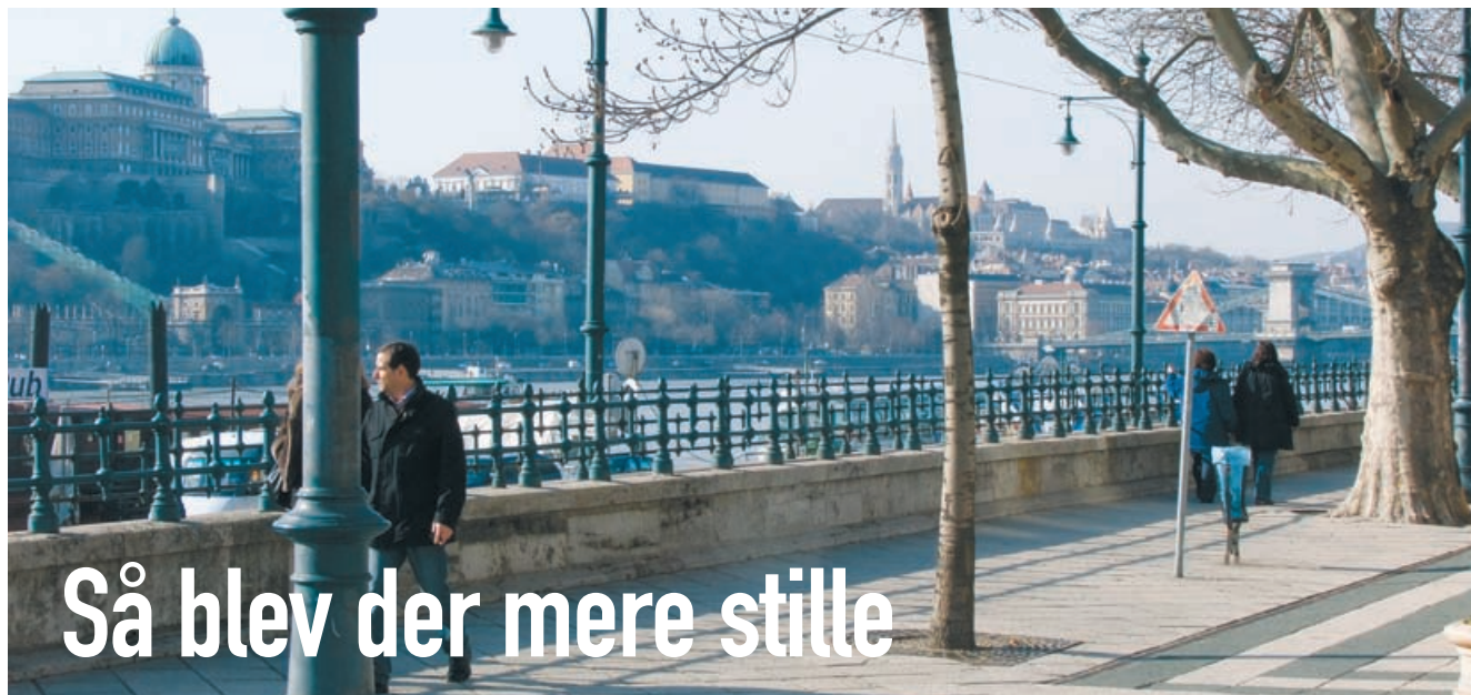
Promenade langs Donau-floden, Budapest.