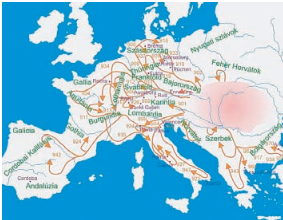
Ungarske felttog i 900-tallet.

UNGARERNE har boet i deres land i mere end tusind år, men de har haft en omtumlet historie. De indvandrede i slutningen af 800-tallet og bosatte sig i både Ungarn og det meste af det nuværende Rumænien. De var frygtede krigere og hærgede det centrale Europa. Men i 995 blev de besejret af den tyske kejser Otto den Store og måtte indstille deres plyndringer.