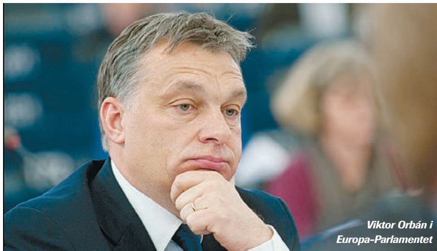
Viktor Orbán i Europa-Parlamentet

Surhed præger klimaet mellem Ungarn, EU og valutafonden IMF. Forhandlingerne om nye lån er afbrudt. Men kan landet klare sig selv? Højest i 6-8 måneder, mener økonomisk analytiker.