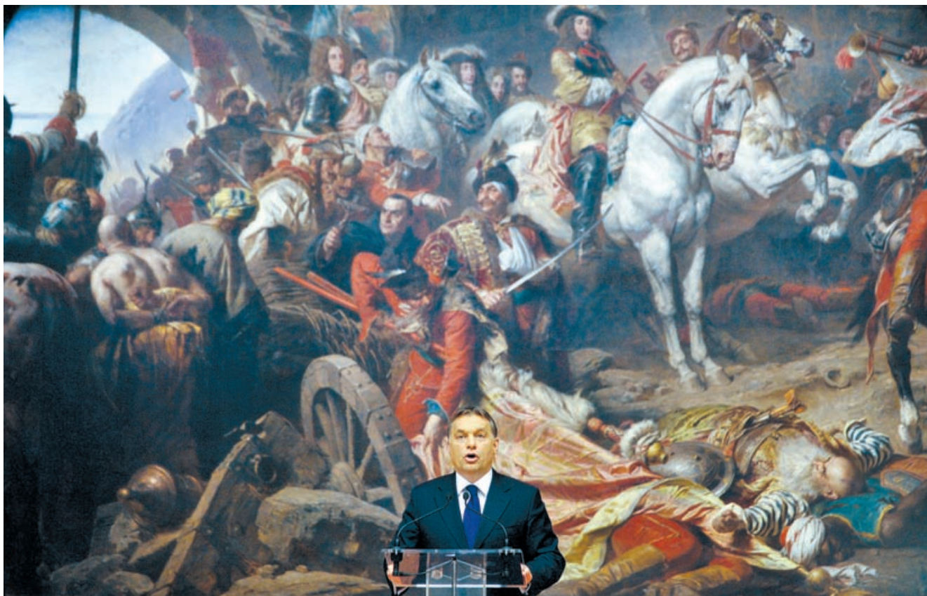
Viktor Orbáns regering fejrede den nye grundlovs ikrafttræden 1. januar med en udstilling af nationalistisk kunst, herunder 17 nyindkøbte lærreder. Nationalgalleriets direktør trådte tilbage i protest mod, hvad han kaldte kunstlivets politisering.