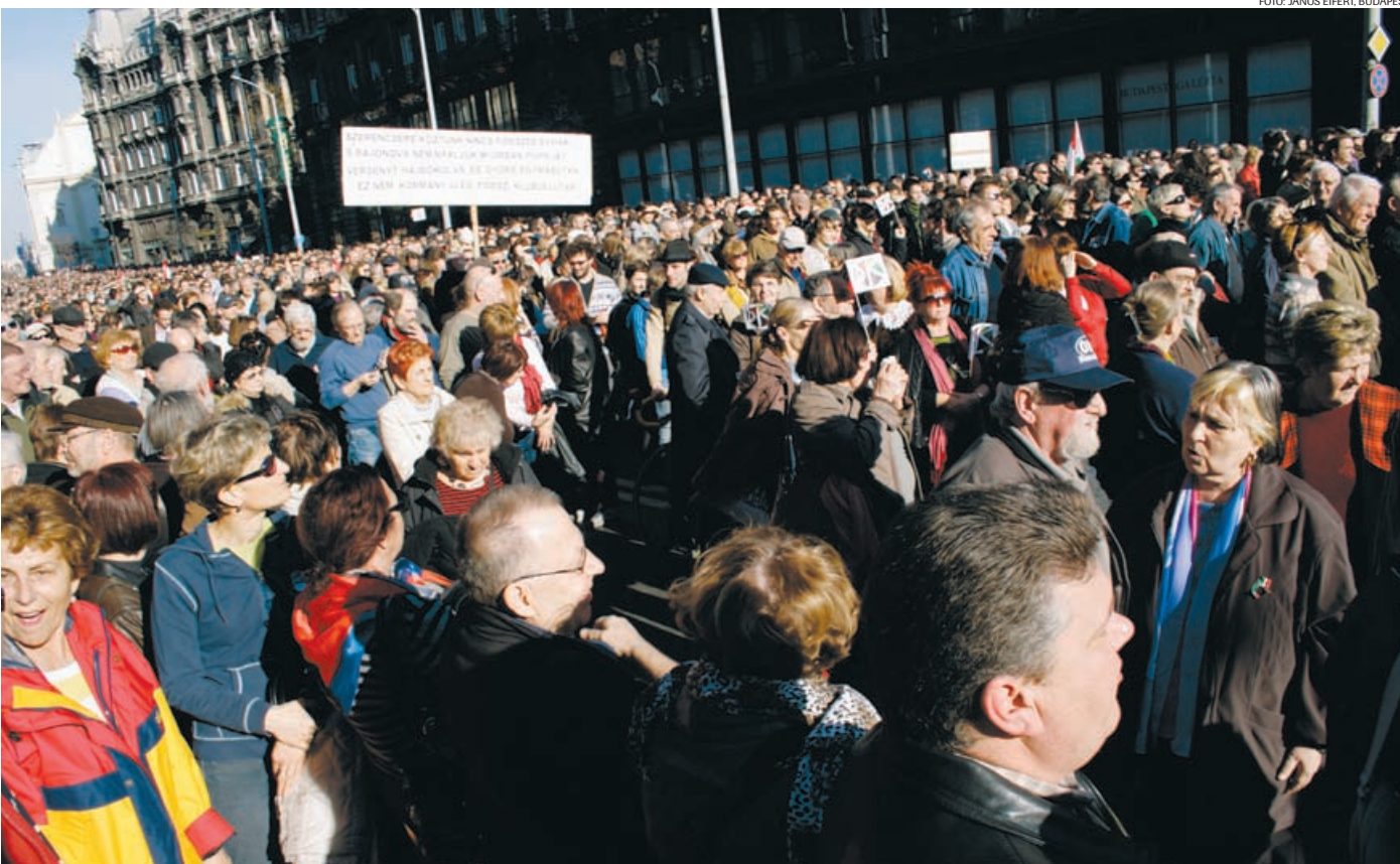
Fra en demonstration i Budapest til fordel for den liberale KLUB-RADIO. Regeringens nye mediemyndighed nægtede at forny dens sendetilladelse, bl.a. fordi den ikke opfyldte nye krav om musik og lokale nyheder.

det er normalt ikke de samme regler for TV, som for online, som for trykte presse, og/eller det er ikke samme myndighed, der udøver kontrol. Ungarn er det eneste land, hvor alle medier reguleres efter én omfattende lov og af samme myndighed.