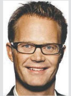
Jeppe Kofod, spidskandidat til EU-Parlamentet for Socialdemokraterne