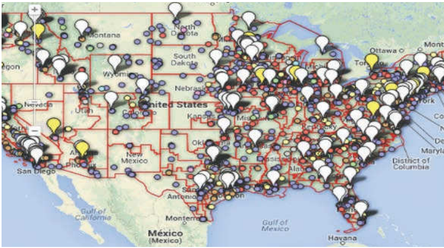
De 75.000 europæiske virksomheder eller krydsregistrerede virksomheder, der med et investeringsafsnit vil få investorerrettigheder i USA.