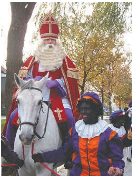
Sinterklaas og hans hjælper Zwarte Piet

Det kan man så gøre i Danmark, hvor udsigten til billige iPad-julegaver stadig fortoner sig i en noget tåget fremtid. Glædelig jul.