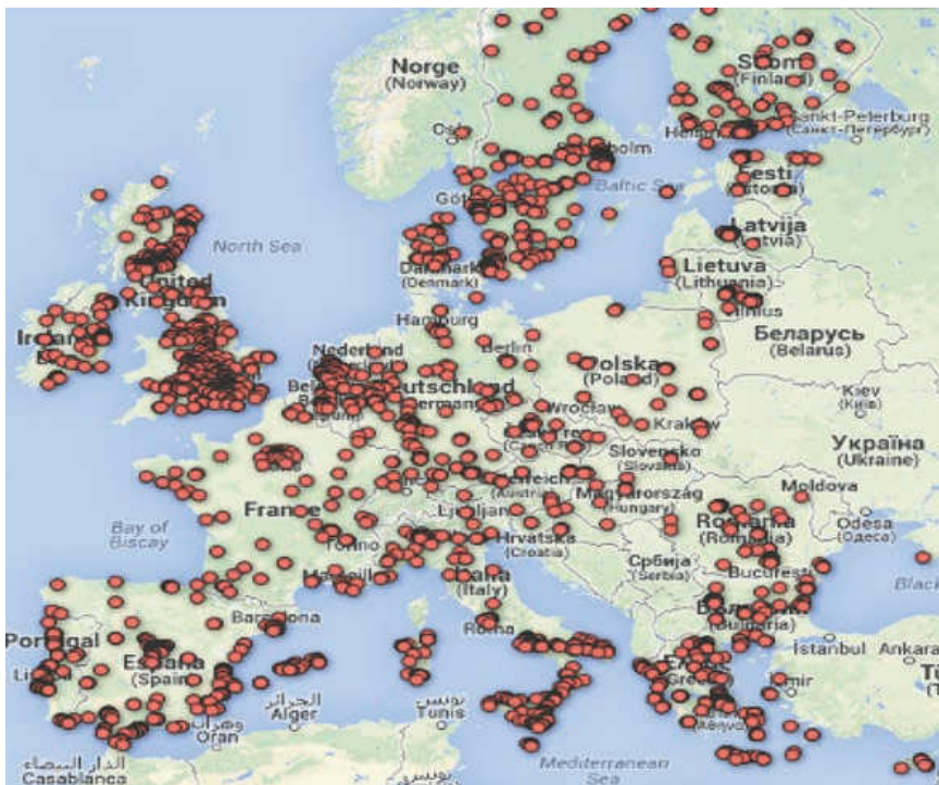
Den amerikanske forbrugerorganisation Public Citizen har udarbejdet et kort over 24.000 amerikanske virksomheders afdelinger i EU, der vil kunne sagsøge stater under en ISDS-mekanisme.

»Når først investeringen er foretaget, kan den politiske dagsorden i værtslandet ændre sig. Nu har værtslandet fået