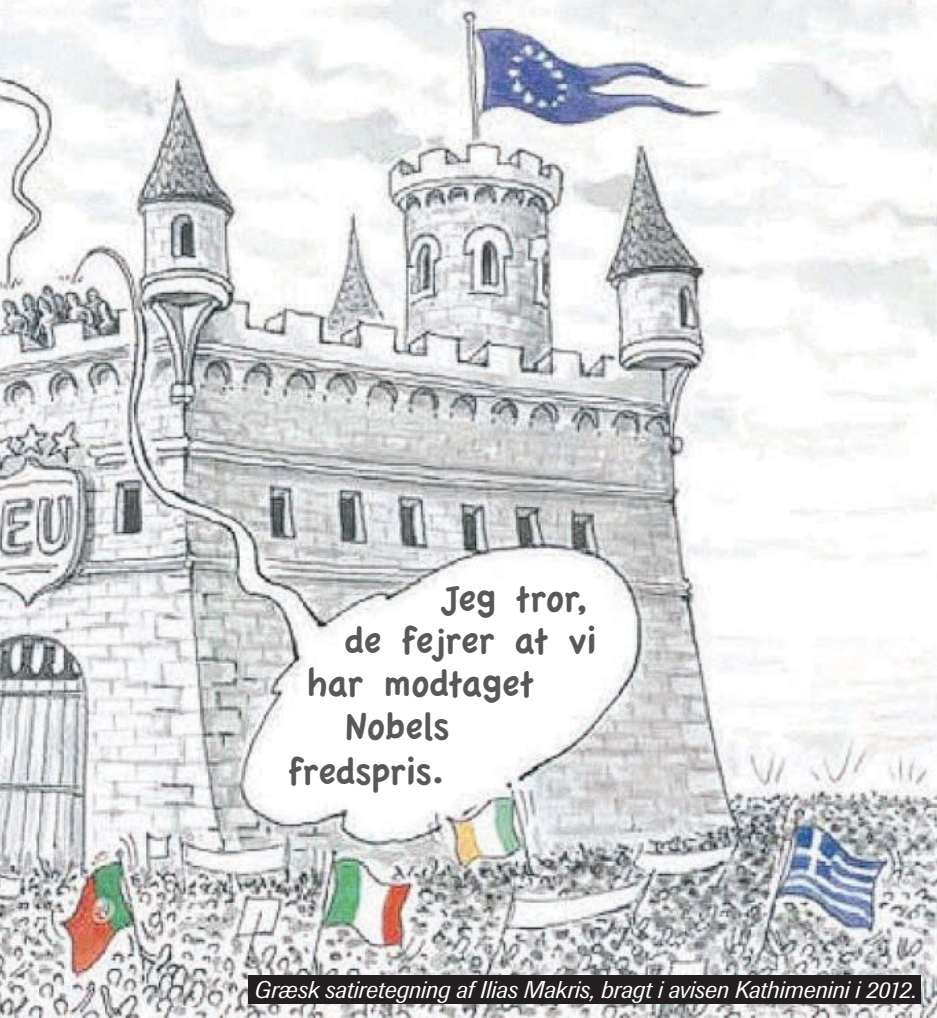
Græsk satiretegning af Ilias Makris, bragt i avisen Kathimerini i 2012.

princip. Men her er min anke, at jeg slet ikke synes EU lever op til sit eget princip, tværtimod!»