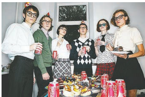
Jubelscene på den årlige Sprogfestival for Sociolinguister, efter offentliggørelsen af 287 nye krise-ord.

Ikke blot er den næsten Monty Pythoniske kategori af "Ni-Nis" (hverken-ellere) slået fast, som betegnelse for den voksende del af den spanske unge generation, der hverken har jobs eller uddannelse.