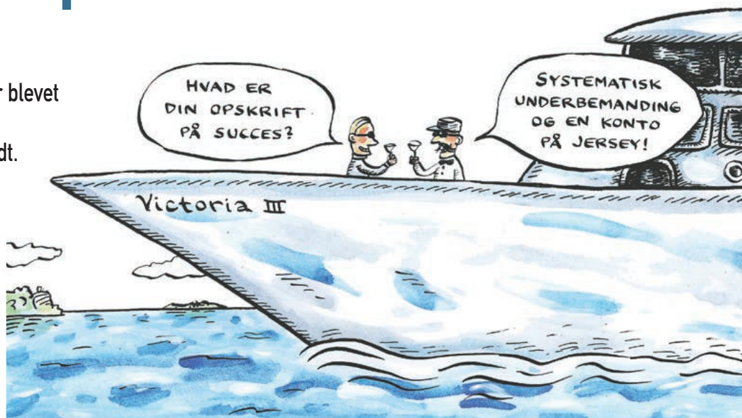
Tegning venligst udlånt og fordansket til NOTAT af den svenske satire-tegner Robert Nyberg.