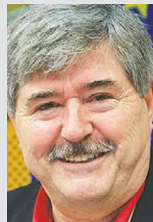
Søren Søndergaard (MEP, Folkebevægelsen mod EU), GUE/NGL