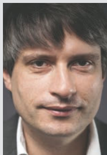
Sven Giegold, tysk MEP, Den Grønne Gruppe