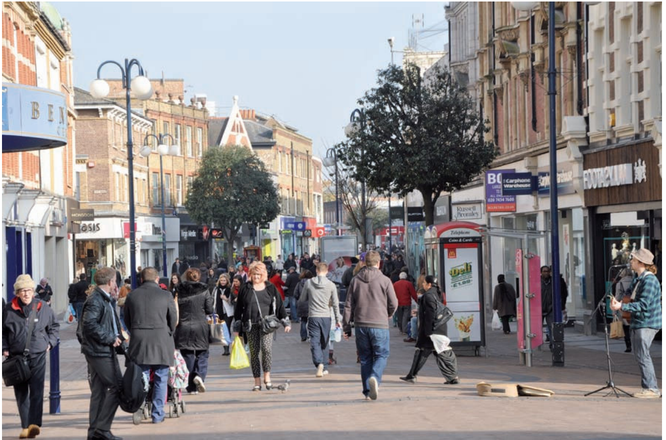
High Street, Kingston upon Thames, godt en halv time uden for Londons centrum.