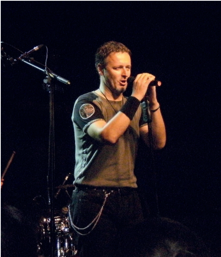
Marco Perković er forsanger i bandet Thompson, som gennem 20 år har samlet kroaterne om patriotiske og, lyder anklagerne, fascistiske budskaber.

Det sker i et nationalistisk Kroatien, som har svært ved at give slip på fortiden.