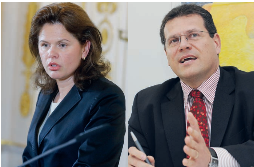
Juncker havde egentlig udpeget sloveneren Alenka Bratušek (tv.) som superkommissær for energiunionen, men hun klarede ikke afhøringerne i Parlamentet. I stedet bliver det slovakken Maroš Šefčovič (th.).

»Dengang agerede Kommissionen som en tæppehandler på markedet i Mar-