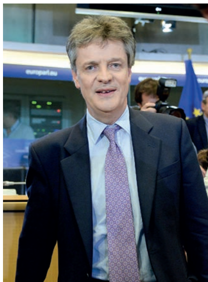
Britiske Jonathan Hill var i mediernes søgelys på grund af sin baggrund i den britiske finansverden, og skulle afhøres hele to gange af Parlamentet. Men så kunne han også gå glad og tilfreds gennem svingdøren til Kommissionens gemakker.

De to selskaber havde oven i købet kontrakter med offentlige myndigheder. Og det er kun en af mange historier om interessekonflikter, der klæber til hans navn.