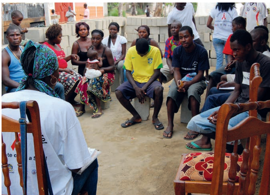
Læger Uden Grænser benytter blandt andet kopimedicinen i deres arbejde mod AIDS i Afrika.

Skulle evalueringerne føre til en ny forhandlingsrunde, tyder intet dog på, at den nye indiske regering har tænkt sig at være blødere over for EU end den forrige. WTO-kollapset har vist, at handels- og industriminister Nirmala Sitharaman ikke er en, man løber om hjørner med. ♦