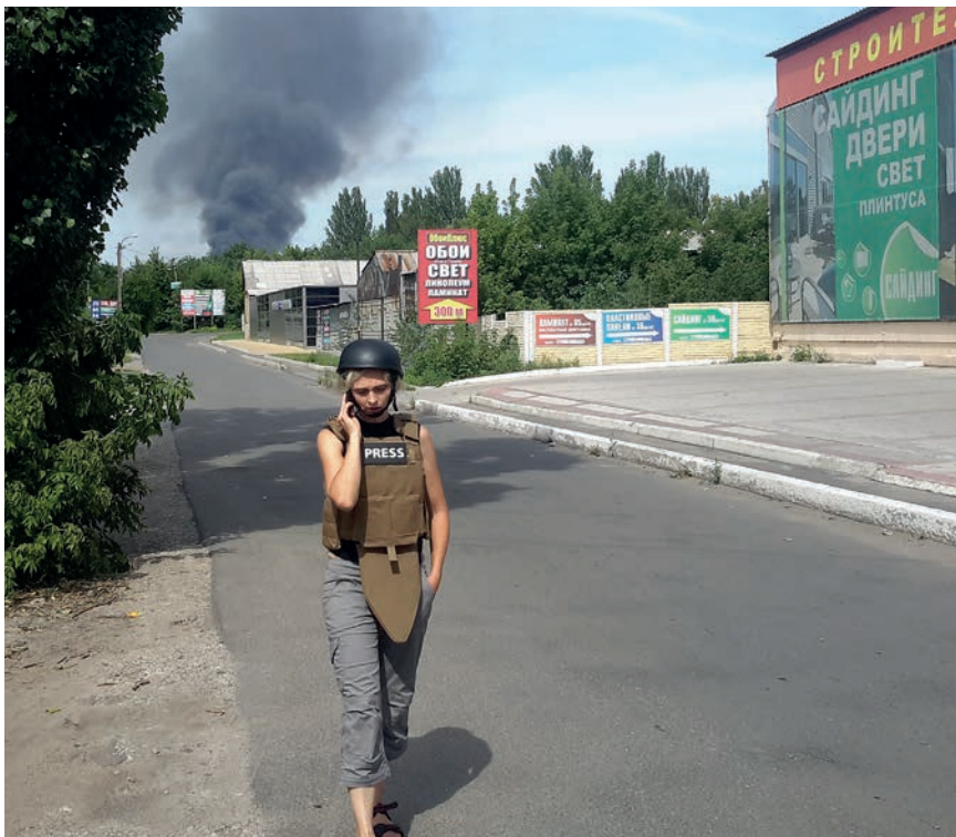
Donetsk, juli 2014. Det gælder om at holde hovedet koldt.

»Hvis vi bakker helt tilbage til Maidan (Uafhængighedspladsen) i februar, så prøvede jeg at undgå at blive revet med af det, der faktisk var en meget overbevi-