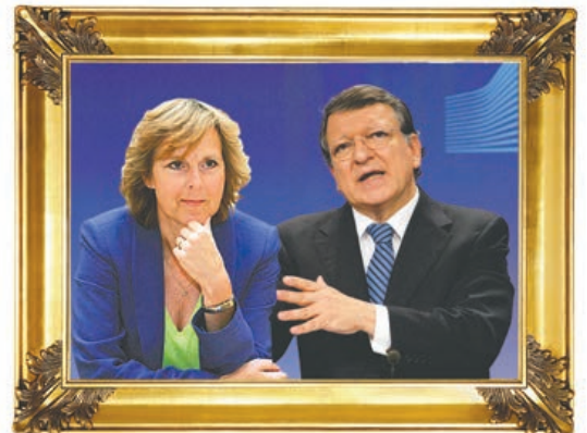
Klimakommissær Connie Hedegaard og formanden for Kommissionen, José Barroso.

Kommissærerne repræsenterer EU og ikke deres hjemlande. Når de træffer beslutninger, kræver det flertal internt i Kommissionen, men det sker oftest i enighed mellem kommissærerne. Kommissionens afstemninger er hemmelige. Kommissionen råder over en fast stab på ca. 25.000 embedsmænd. De er fordelt i generaldirektorater, hvilket svarer nogenlunde til ministerier.