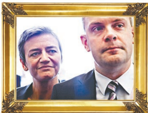
Økonomi- og indenrigsminister Margrethe Vestager og Finansminister Bjarne Corydon.