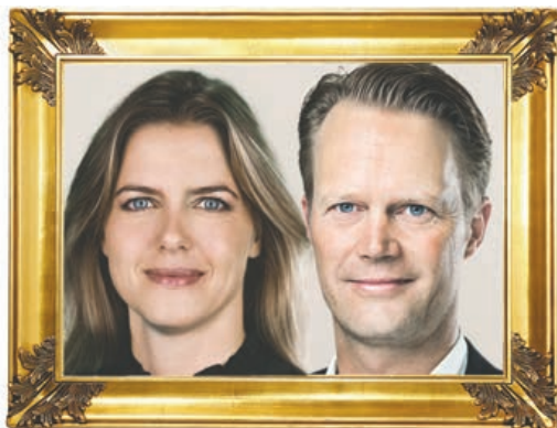
Ellen Trane Nørby (V) og Jeppe Kofod (S), spidskandidater til EU-Parlamentsvalget 2014.