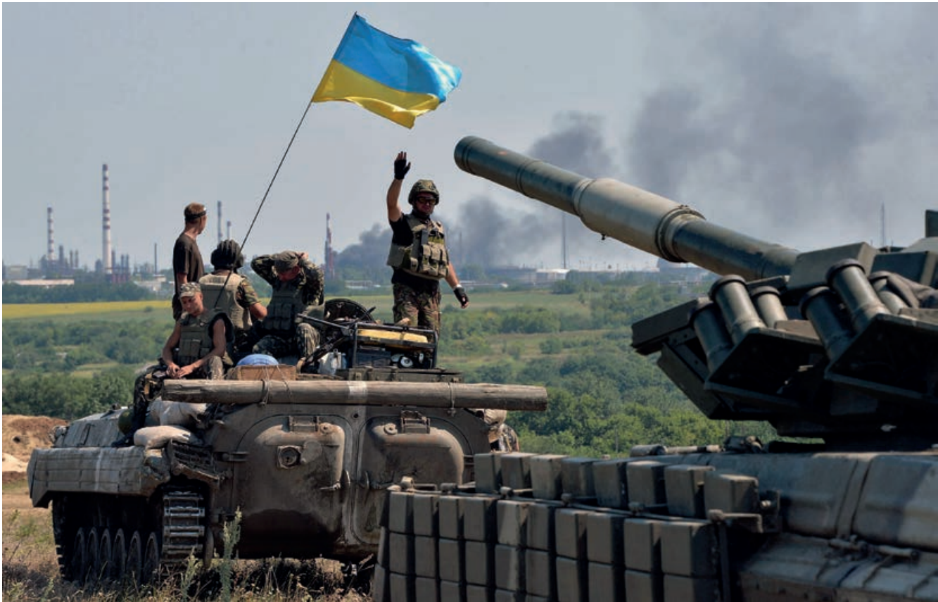
Konflikten i Ukraine startede, da den daværende regering afviste en samhandelsaftale med EU. Her er det kampvogne ved den oprørske Donetsk-region i den østlige del af landet.

et samlet europæisk hus og en anden sikkerhedsstruktur i Europa, skulle man have lyttet til. Desværre var NATO ikke interesseret i at samarbejde og finde en ny struktur. Man var derimod interesseret i at få fastholdt sin betydning og få delt Jugoslavien, og det smælder tilbage i dag som en boomerang i mine øjne. At udvide med det atombevæbnede NATO op under skørterne på et såret Rusland betragter jeg som historisk idioti.«