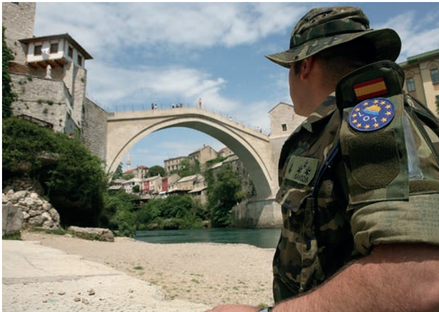
Soldat fra EU's fredsbevarende mission EUFOR/Althea i Bosnien. Siden Dayton-aftalen i 1995, der endte den jugoslaviske krig, er Kroatien blevet optaget i EU.