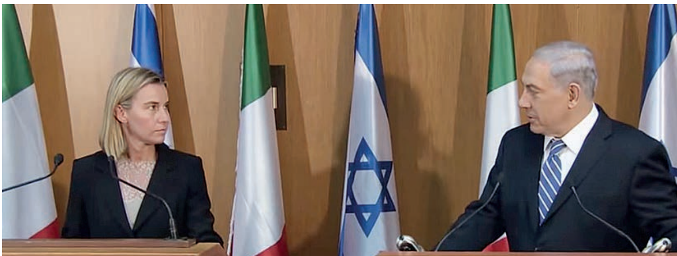
Møde mellem EU's Høje Repræsentant (udenrigsminister), Federica Mogherini, og Israels premierminister Benjamin Netanyahu.

Problemet er så, at bosættelserne efterhånden består af mere end 500.000 israeleere i Østjerusalem og på Vestbredden. Det faktum betyder, at en to-statsløsning kan blive meget svær at forhandle sig frem til, uanset hvad Mogherini siger. ♦