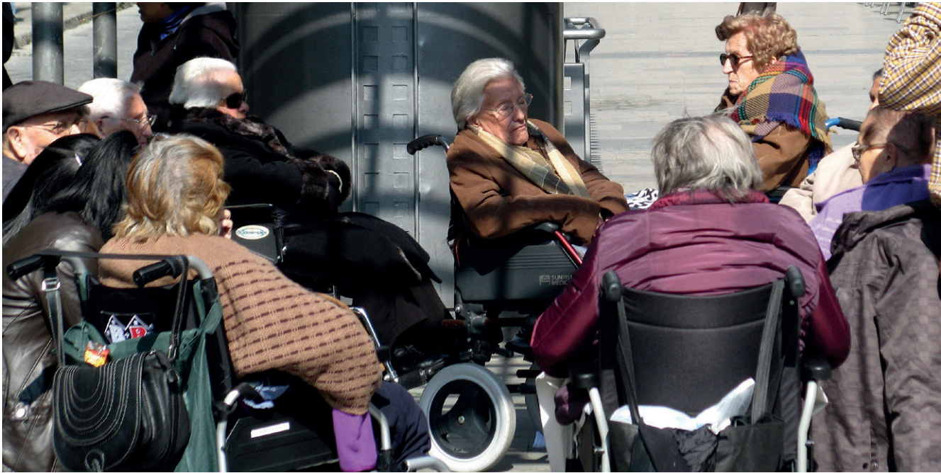
Flere og flere danske kommuner privatiserer plejehjem. Nye handelsaftaler kan forpligte Danmark til at åbne op for udenlandsk konkurrence på området.