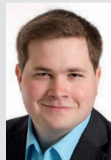
til medlem af Europa-Parlamentet, Anders Primdahl Vistisen (DF) fra ECR-gruppen,