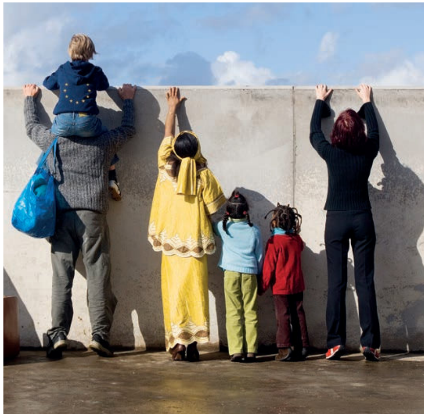
Hvor går grænserne for den frie bevægelighed?

Som det fremgår af traktatens art. 152 stk. 1, "støtter og supplerer Unionen medlemsstaternes indsats" på det social- og beskæftigelsesmæssige område. Men enighed blandt medlemsstaterne om en tidssvarende opdatering af regelsættet har vist sig at være en kompleks affære, hvilket bl.a. kan ses i EU-lovgivning som Håndhævelsesdirektivet, Udstationeringsdirektivet og Forordningen om koordinering af social sikring, der alle regulerer vandrende europæiske arbejdstageres rettigheder.