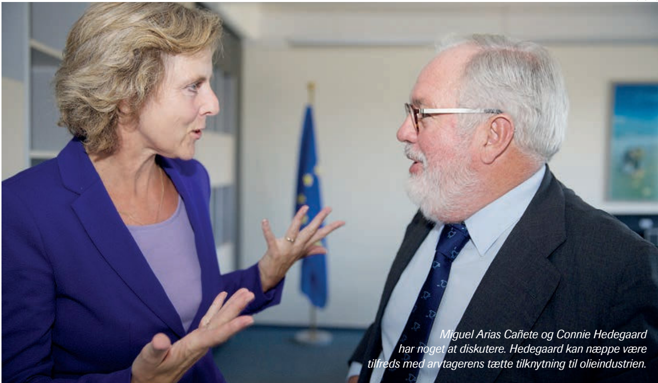
Miguel Arias Cañete og Connie Hedegaard har noget at diskutere. Hedegaard kan næppe være tilfreds med arytagerens tætte tilknytning til olieindustrien.