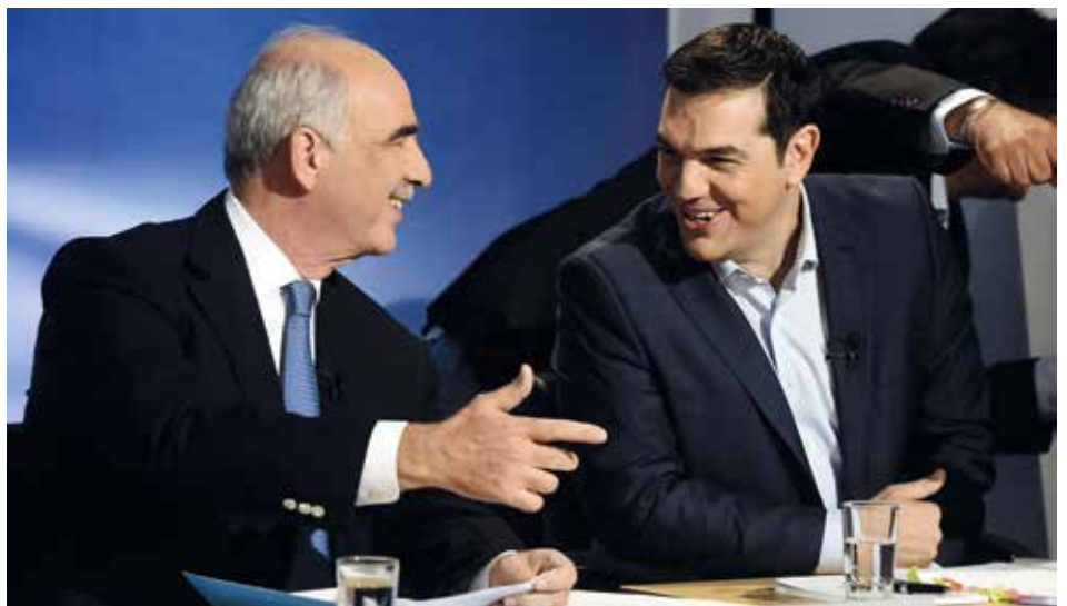
Den konservative Vangelis Meimarakis kaldte den røde Alexis Tsipras ”knægt”. Tsipras kvitterede ved at forbinde Meimarakis med ”den gamle elite”.

På den baggrund er det måske ikke så svært at forstå personangrebene i den græske valgkamp. Hvad skulle de ellers snakke om. Nok var det spændende, hvem der ville vinde. Men hvilken politik, der ville vinde, vidste vælgerne i store træk på forhånd. ♦