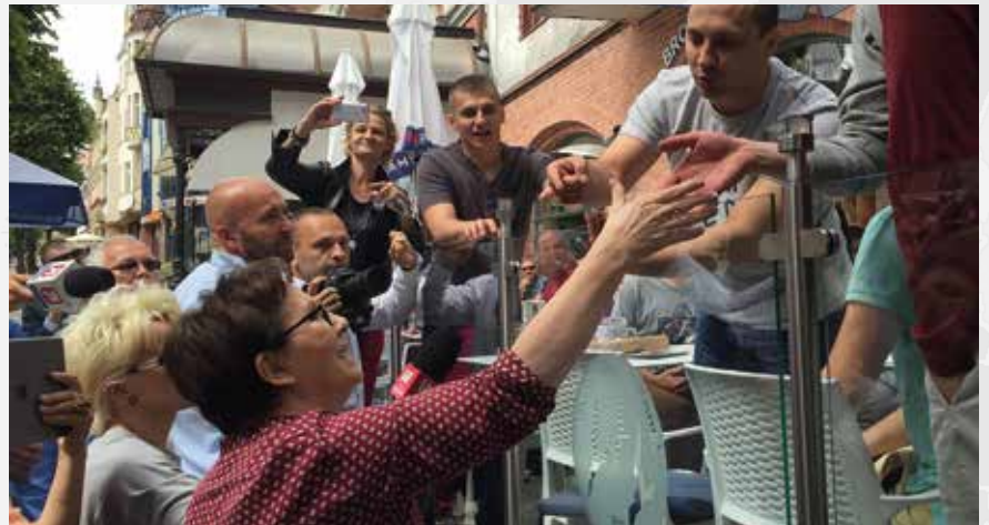
Ewa Kopacz, statsminister og leder af Borgerplatformen (PO) tog en togtur rundt i Polen for at møde vælgerne.

præsidentvalget har Borgerplatformen haltet efter Lov og Retfærdighed med omkring ti procent.