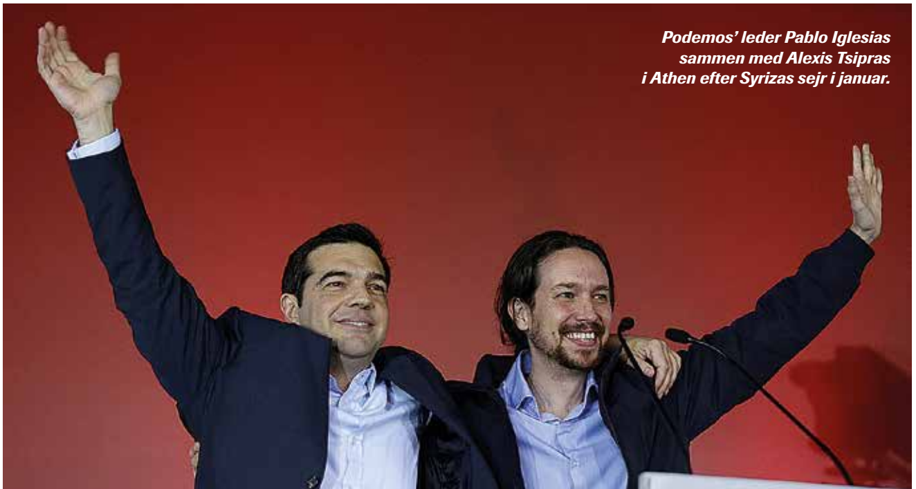
Podemos' leder Pablo Iglesias sammen med Alexis Tsipras i Athen efter Syrizas sejr i januar.