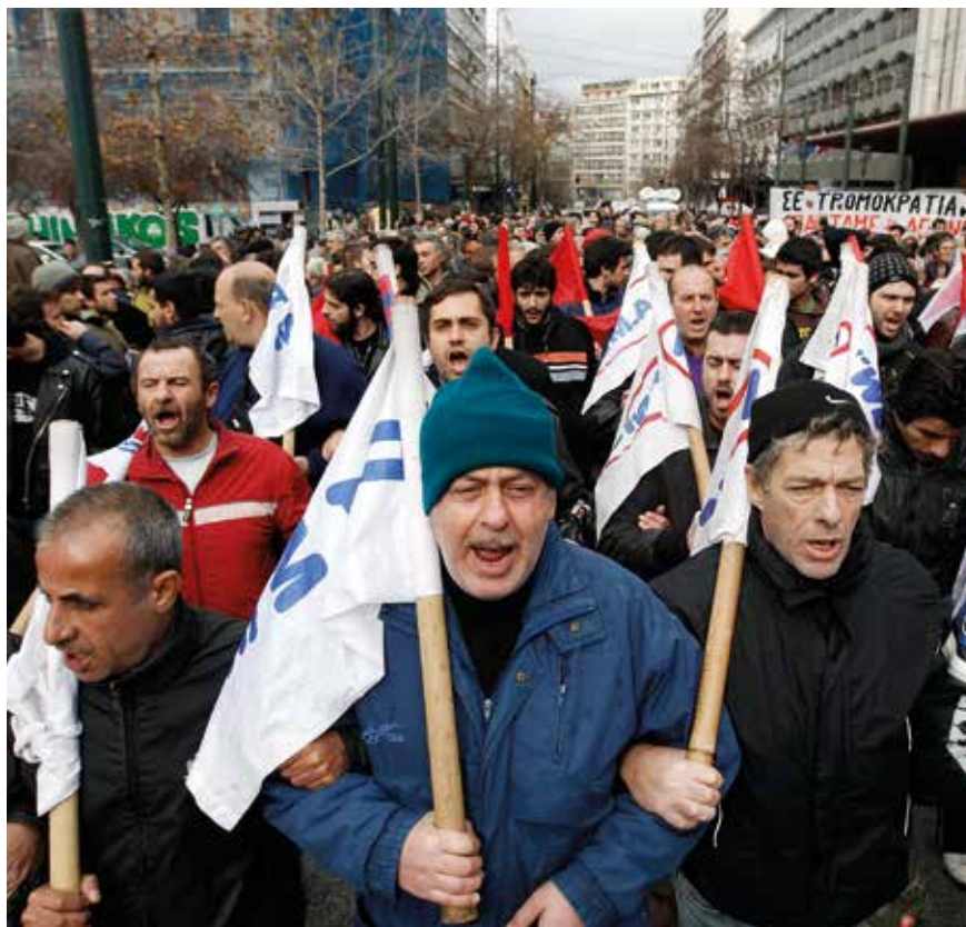
Ifølge låneaftalen skal strejker og overenskomstforhandlinger i Grækenland gennemgås og tilpasses "bedste europæiske praksis".

Du kan finde links til de to låneaftaler på www.notat.dk