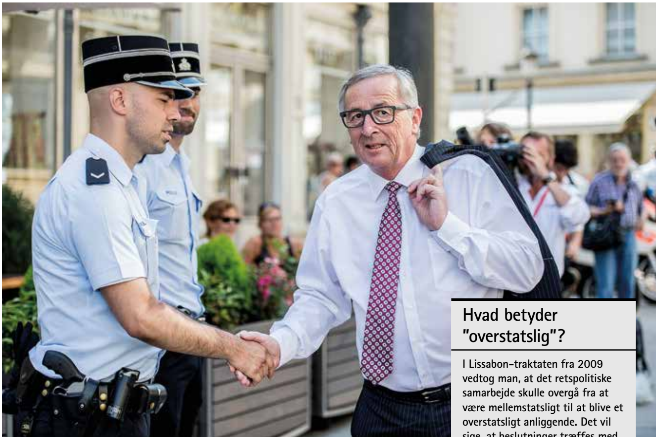
Europol bliver overstatsligt. Her ses kommissionsformand Jean Claude Juncker trykke hånd med lovens lange arm.