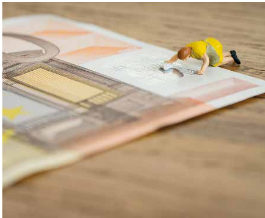
Blandt Europol's kerneopgaver er bekæmpelsen af grænseoverskridende kriminalitet, herunder hvidvaskning af penge.

Kilde: European Police Office (Europol): Past, Present and Future af Libor Klimek i Czech Yearbook of International Law 2014