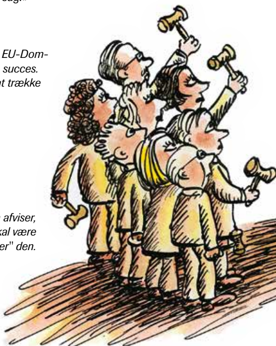
Illustration: Robert Nyberg