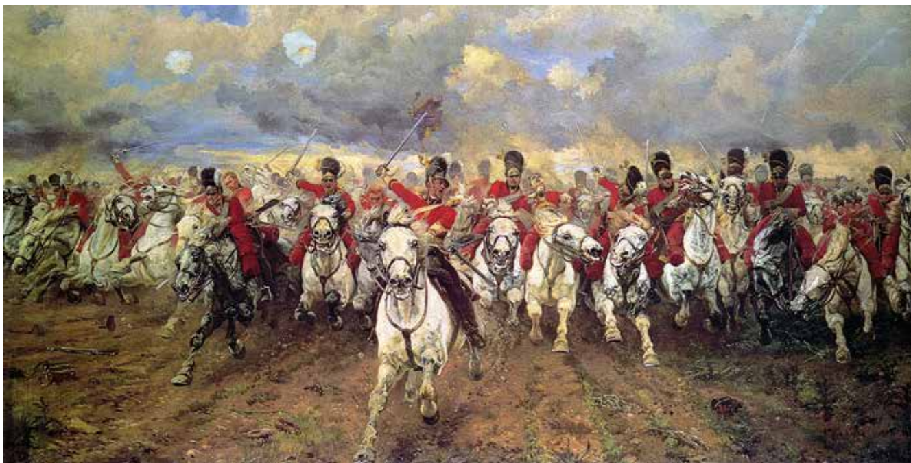
Praksisorienterede? Briterne stormer frem ved Waterloo 1815.