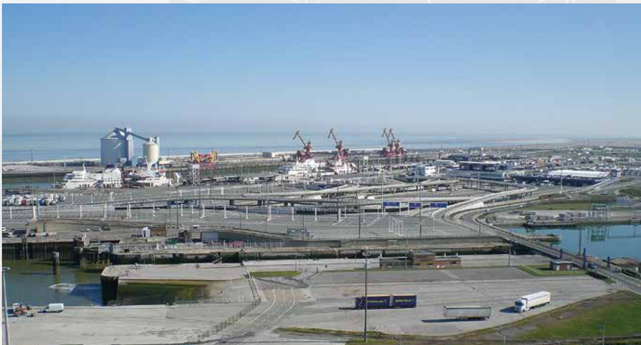
Havnen i Calais, hvorfra flygtninge forsøger at krydse den engelske kanal.