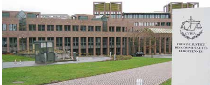
Hvis EU får en fælles straffelov, får EU-Domstolen i Luxembourg udvidet sit kompetenceområde.