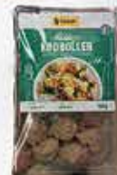
MIDDAGS KØDBOLLER Tulip Food Company

producenten oplyser, at der anvendes mange forskellige kødleverandører blandt andet fra Danmark, Tyskland, Holland og Østrig.