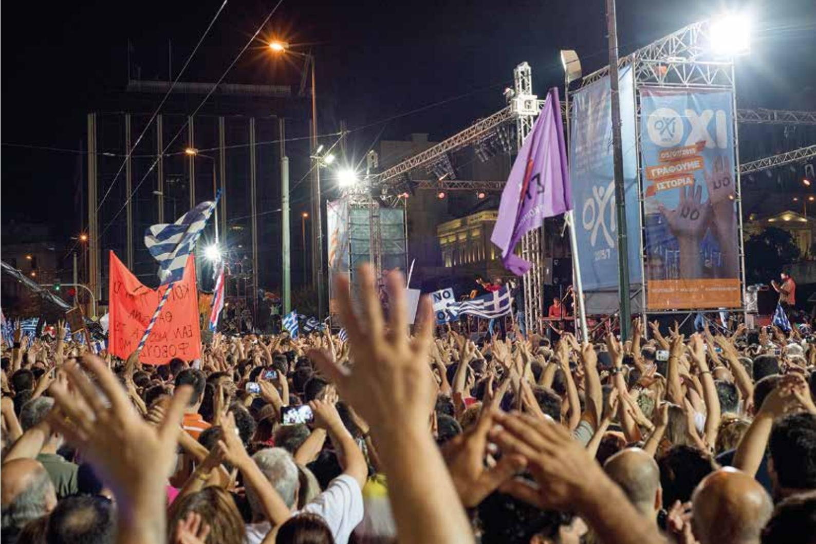
Få dage inden folkeafstemningen den 5. juli opfordrede demonstranter i Athen til et nej til flere besparelser. De vandt afstemningen, men fik ikke opfyldt deres ønske.

en økonomisk politik, som altid har været forbundet med den liberalistiske højrefløj.