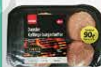
KYLINGE BURGERBØFFER COOP A/S

producenten ønsker ikke at oplyse oprindelseslandet af konkurrencemæssige hensyn