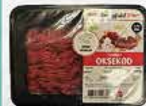
HAKKET OKSEKØD SMAGFULD FOR REMA 1000

kyllinge burgerbøffer er produceret af Danpo A/S, der slakter og forarbejder danske kyllinger.