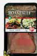
ROASTBEEF Skare A/S

DEN DAN Skare A/ produce vendes verand Danma Østrig.