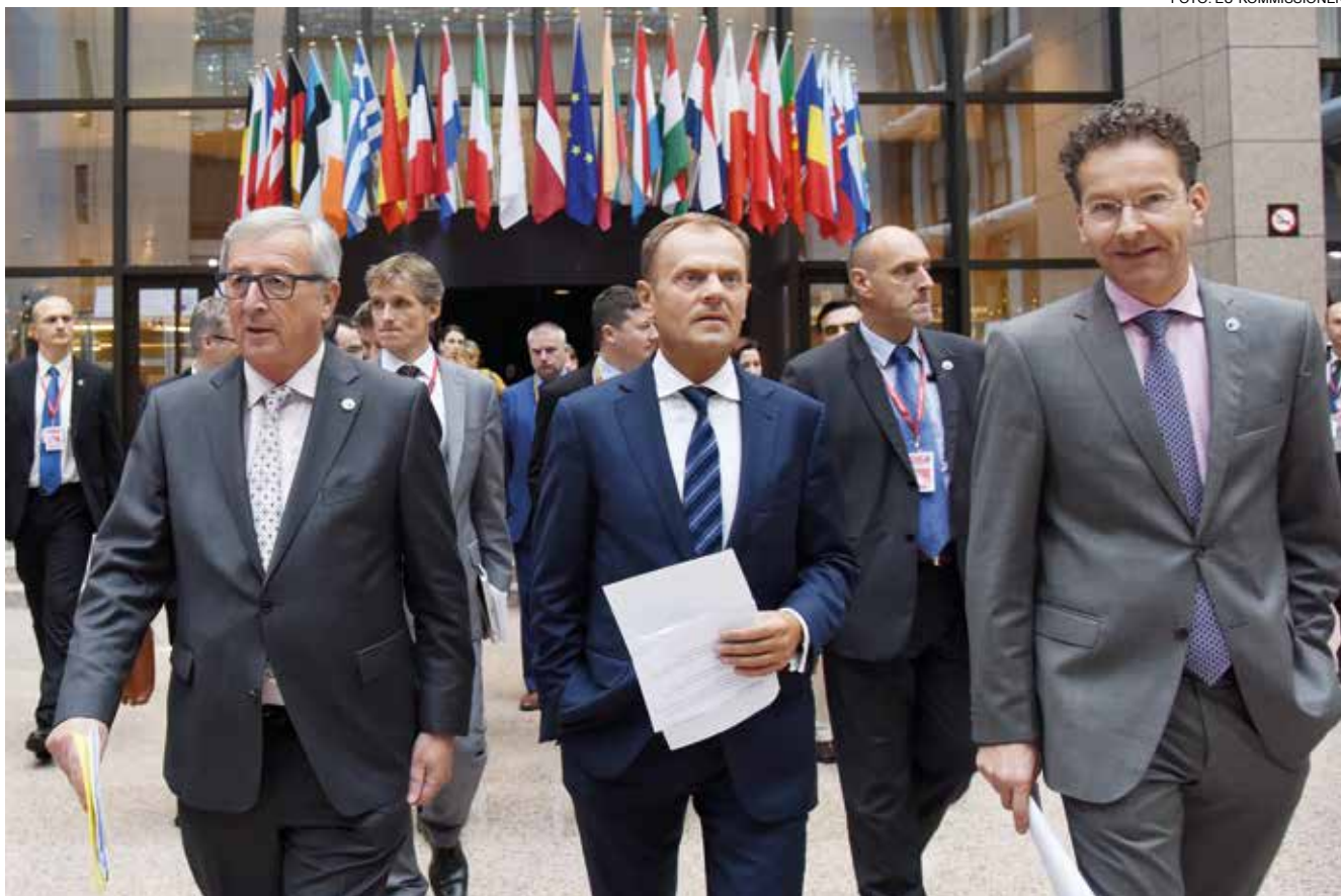
Tre af de fem ledere: Jean-Claude Juncker (tv.), Donald Tusk og Jeroen Dijsselbloem (th.)