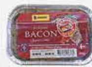
BACON LEVERPOSTEJ Tulip Food Company

af emballagens bagside fremgår det, at kødbollerne er produceret af kød fra Danmark og andre EU-lande.