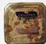
KYLINGEBACON SALAT Graasten Salater

produceret primært af dansk svinelever og tysk bacon. Dog skiftes leverandørerne jævnligt.