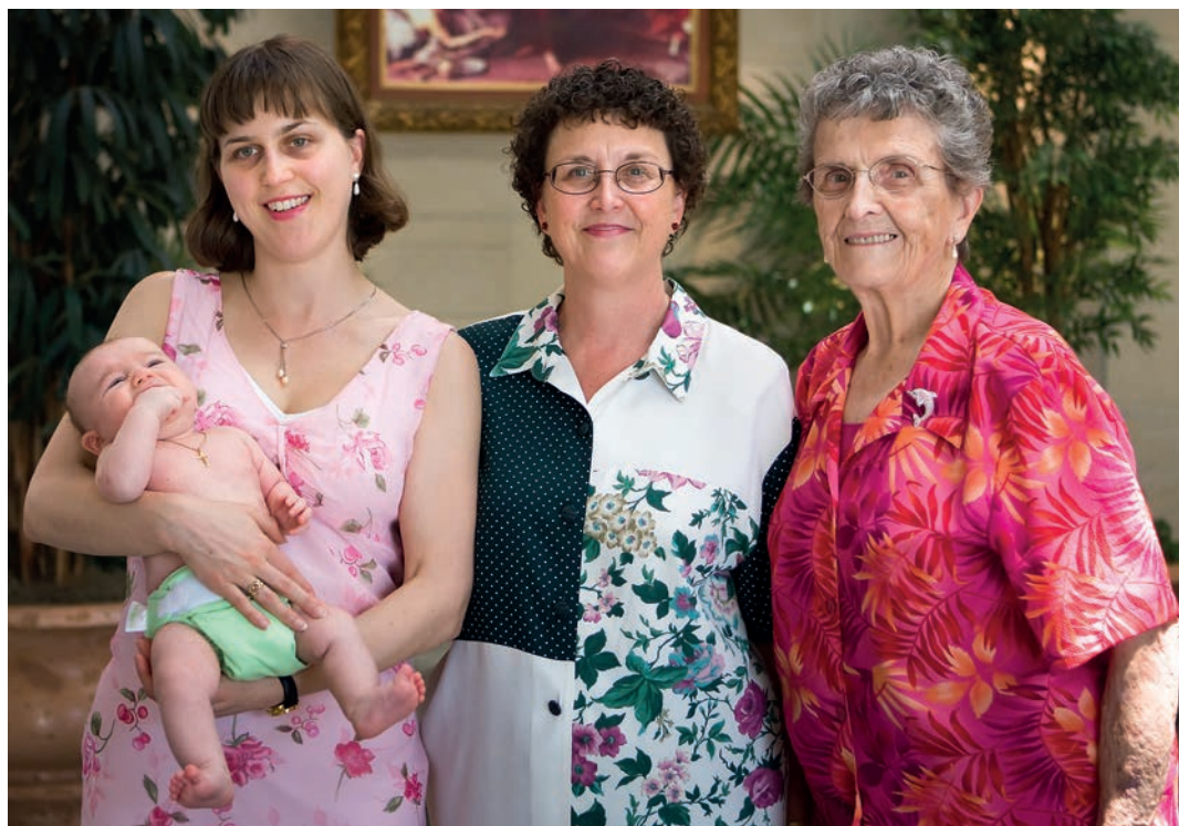
I den lille østat Malta har der traditionelt fokus på moderskabet frem for karrieren. Her ses en lille maltesisk dreng med sin mor, mormor og oldemor.

Var lønforskel mellem kønnene den eneste målestok, ville Estland dog være absolut taber. I 2013 fik kvinderne ifølge Eurostat næsten en tredjedel (29,9 pct.) mindre i løn end deres mandlige kollegaer. ♦