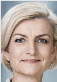
til Ulla Tørnæs Valgt ind i EU-Parlamentet for Venstre (ALDE-gruppen)